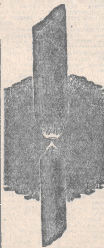
LAMPY LUKOWE. — Dwa wałeczki węgla retortowego

galo dużych wkładów. Trzeba było stworzyć specjalne zakłady (gazownie) w celu wytwarzania gazu i wprowadzać podziemne przewody aż do miejsc, w których miało się zakładać oświetlenie gazowe. I dlatego natrafiało na duże trudności w wprowadzeniu go do mniejszych osiedli. W czasach w jakich jesteśmy największe zastosowanie ma oświetlenie elektryczne. Na szeroką skalę wprowadzono je w połowie XIX wieku, kiedy to Foucault de lampy lukowej użył twardego grafitu zamiast węgla drzewnego. Wynalazek ten umożliwił dopiero szerokie zastosowanie lukowego światła elektrycznego. Prawie równocześnie sbuildował Starr (w Cincinnati) pierwszą żarówkę. Od tego czasu ulepszenia oświetlenia elektrycznego następują szybko jedno po drugim i przyczyniają się do coraz szerszego jego zastosowania na całym świecie.