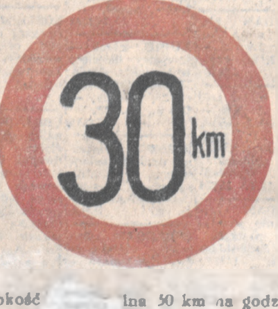
Szybkość 30 km na godzinę.

G. 10—11. REKOPISÓW NIE ZWRACAJĆ — Korespondenci 105-21. — Administracja