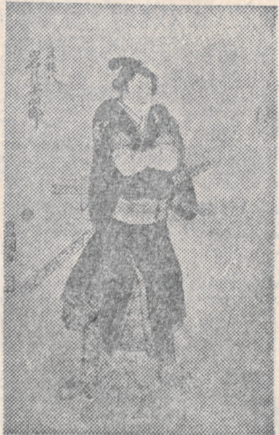
AKTOR W ROLI SAMURAJA

Aby zostać kapłanem Uzumy, należy być przyjętym do szkoły sławnego mistrza, a następnie po długiej nauce czekać na pozwolenie występu. W ten sposób utrzymuje się stan aktorów w patriarchalnym poczuciu