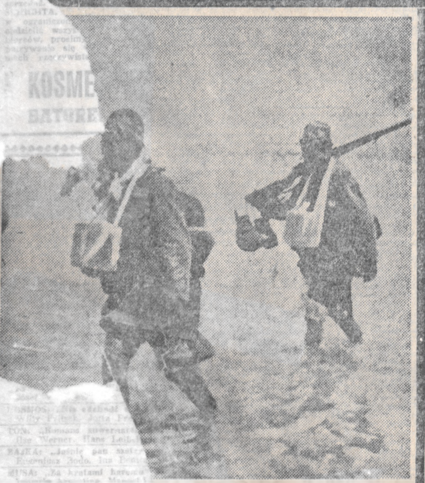
ACH PACZKI Z POPIOŁAMI POLEGŁYCH WOJOWNI N SPÓSOB BIORA NADAL UDZIAŁ W WALCE.