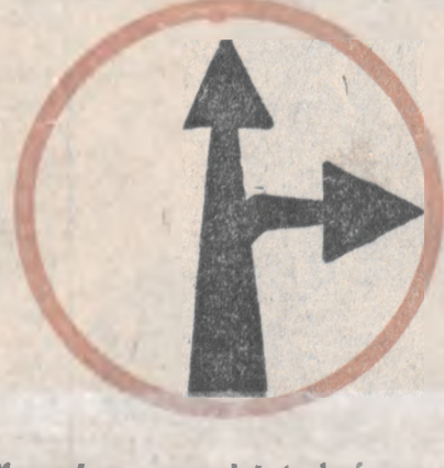
Skrecać na prawo lub jechać wprost.