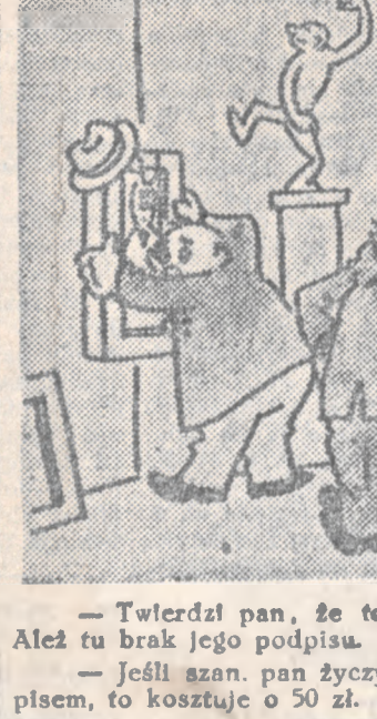
- Twierdził pan, że to Rembrandt? Ależ tu brak jego podpisu. - Jeśli szan. pan życzy sobie z podpisem, to kosztuje o 50 zł. więcej.

SPRZEDAM aparat fotograficzny Agfa... MARYNARKE popielatą, spodnie, jesionkę... 19270