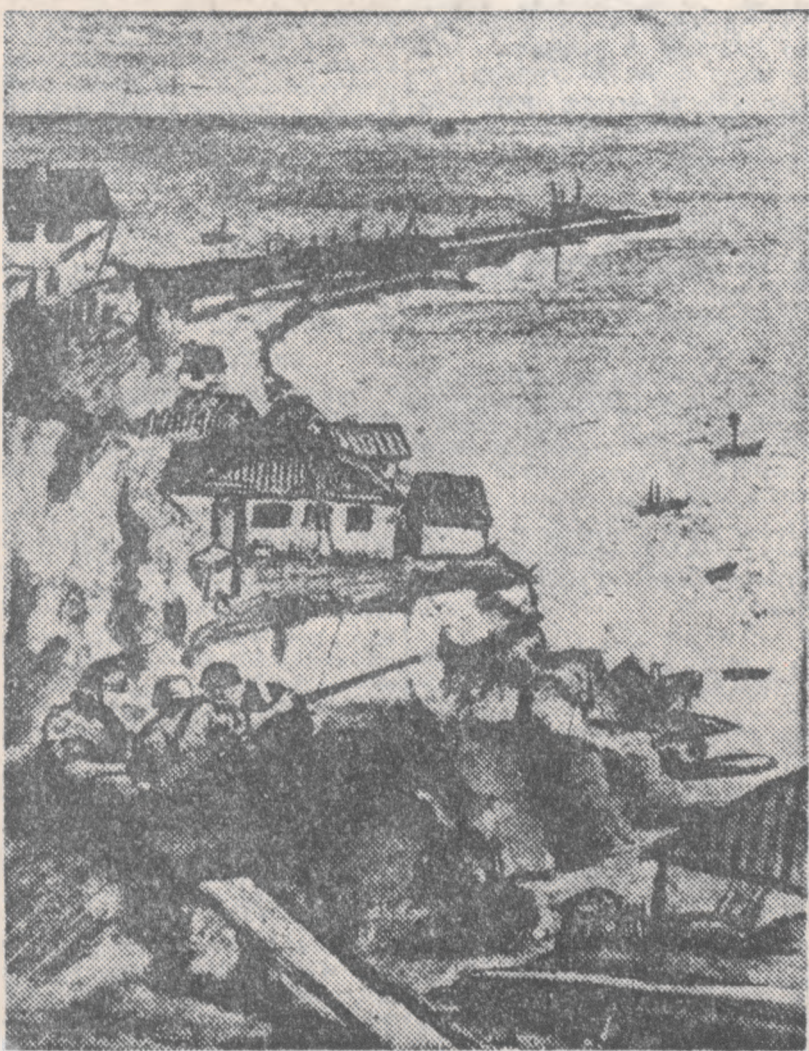
WYBRZEŻE ZDOBYTEGO POŁWYSPU KERCH

Eskadry lotnictwa niemieckiego niezmordowanie wspierały ataki armii lądowej. Na skutek ataków niemieckich samolotów nerkowych w pewnej bolszewickiej dywizji strzeleckiej, która poraz pierwszy wzięła udział w walce, wybuchła dzika panika. Krwawe straty bolszewików powiększyły się z tego powodu jeszcze bardziej. Te sowieckie dywizje strzeleckie i masę dwóch dalszych sowieckich grup bojowych zniesiono w walkach. 3.500 poległych bolszewików zasało pole bitwy. Wzięto dokładnie tysiąc jeńców, zdobywając sześć czołgów, 119 granatników, 202 karabiny maszynowe i wiele innego materiału. Znamienne wysoka cyfra zdobytej ciężkiej broni piechoty, świadczą dobitnie o wielkości osiągniętego sukcesu.