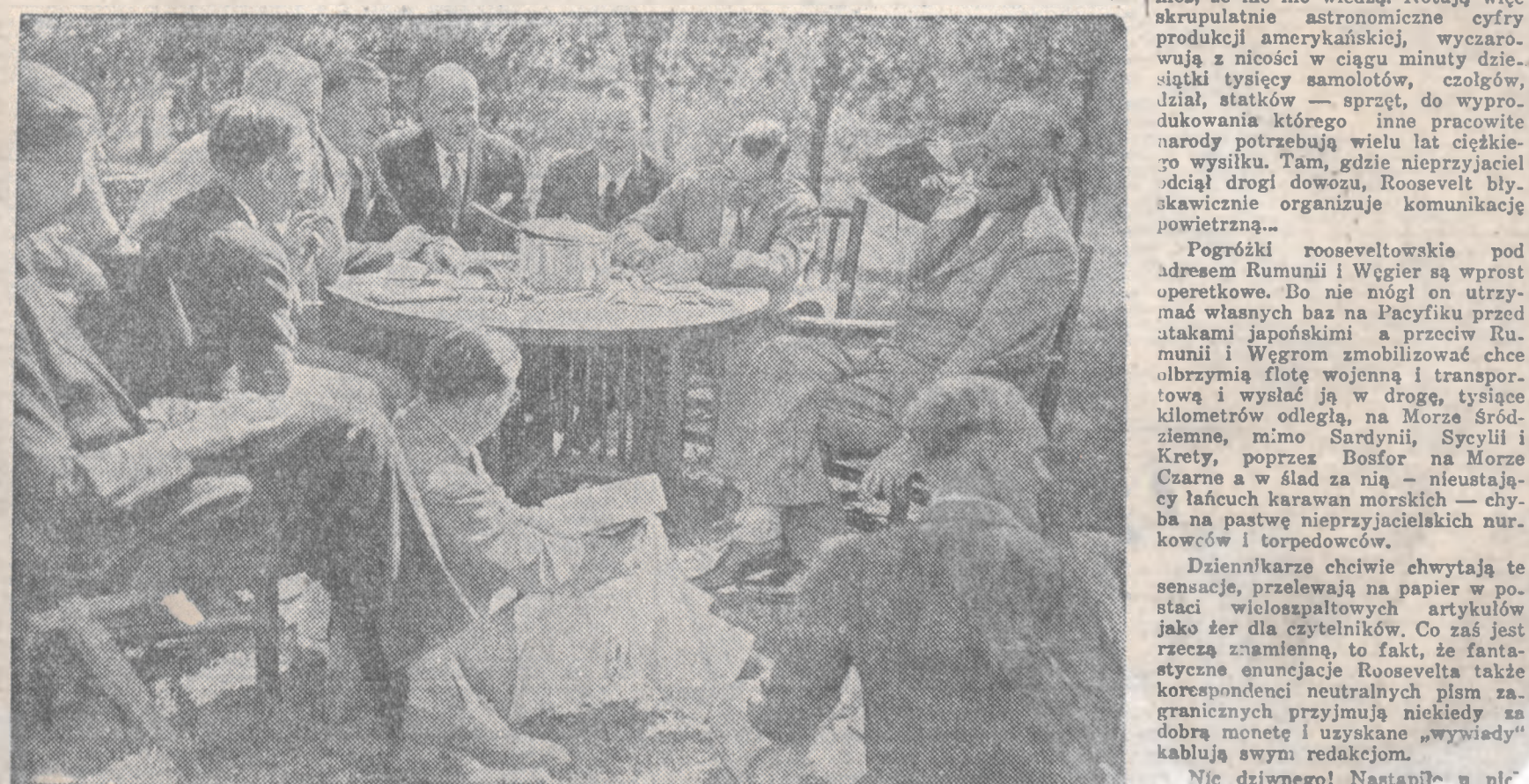
„GARDEN-PARTY” DLA PRASY U ROOSEVELTA.

Nie dziwnego! Nastąpiło u nich pomieszanie pojęć, nie więc już rozróżnienie od rzec.