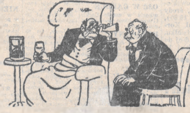
Stary John Bull: „Co to za trzaski, czy to nasze armaty?“ Churchill: „Nie, to imperium brytyjskie tak trzeszczy.“