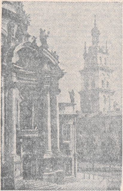
FASADA KOŚCIOŁA DOMINIKANÓW ORAZ WIEŻA KORNIAKTOWSKA

— Na ul. Kazimierzowskiej wpadł pod koła przejeżdżającego samochodu Reisa Adolf, lat 40 (Lindego 10) doznając złamania kości udowej, ran głowy i kontuzji ogólnych. Lekarz Pogotowa przewiózł ofiarę nieszczęśliwego wypadku do szpitala przy ul. Kuczwicza 5.