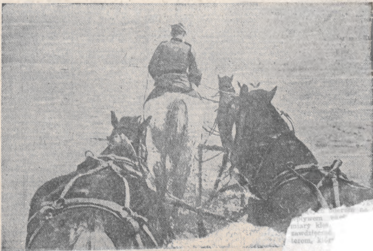
ŁOZTOPY NA FRONCIE WSCHODNIM. Droga rosyjska, zamieniona przez rozw...

BERLIN, 30. 5. — Według doniesienia z miarodajnych kół wojskowych, odniosła marynarka wojenna i lotnictwo mocarstw osi w walce przeciwko marynarce wojennej aliantów od chwili wybuchu wojny, wzgl. przystąpienia Włoch i Japonii do wojny następujące sukcesy. Zatopiono: 12 okrętów bojowych, 68 krążowników, 11 lotniskowców, 144 kontrtorpedowce, 177 łodzi podwodnych, 35 łodzi patrolowych, 126 krążowników pomocniczych i 109 okrętów wojennych innego rodzaju.