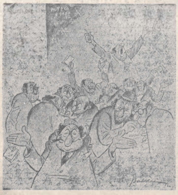
„Nu, w najgorszym razie znajdę sobie gdzieś cichy zakątek w świecie i będę żył z procentów po alianckiej plajcie”.