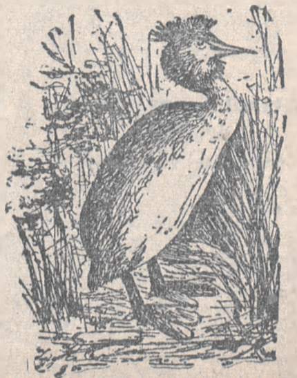
PERKOZ DWUCZUB TY,

Prawdziwki natomiast będą skromniejsze. Jakgdyby wiedziały, że ich szukać będzie człowiek skwapliwie. Należy się tedy ukryć przed pożądanym okiem. Jak sarna udaje, że jest zwiędłym krzewem jałowca, jak zając siedzący na śniegu upodabnia się do okłotu słomy, tak i grzyb prawdziwy wie, że musi przyjąć barwę ochronną, aby zmylić tropy: udaje tedy, że jest zwiędłym liściem zapadłym głęboko w mchyl... Drogę do niego i prawdę o nim zna tylko granatowy ślimak, który zaślini się cały z irytacji, zobaczywszy, że człowiek wabrał już całą kobiałkę.