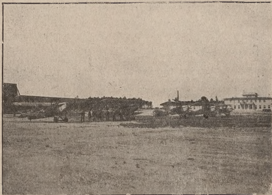
Lotnisko w Katowicach.