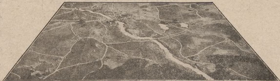
Fotografia mapy plastycznej kpt. Sidora.

ją one łatwo swój kształt pod wpływem czynników atmosferycznych lub nieostrożnego obchodzenia się (piasek), wreszcie dość drogo kosztują. Nie można zmieniać je tak często,