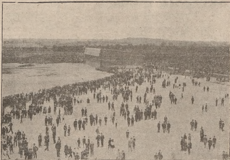
Loty pasażerskie na lotnisku w Katowicach po poświęceniu Dworca Lotniczego.