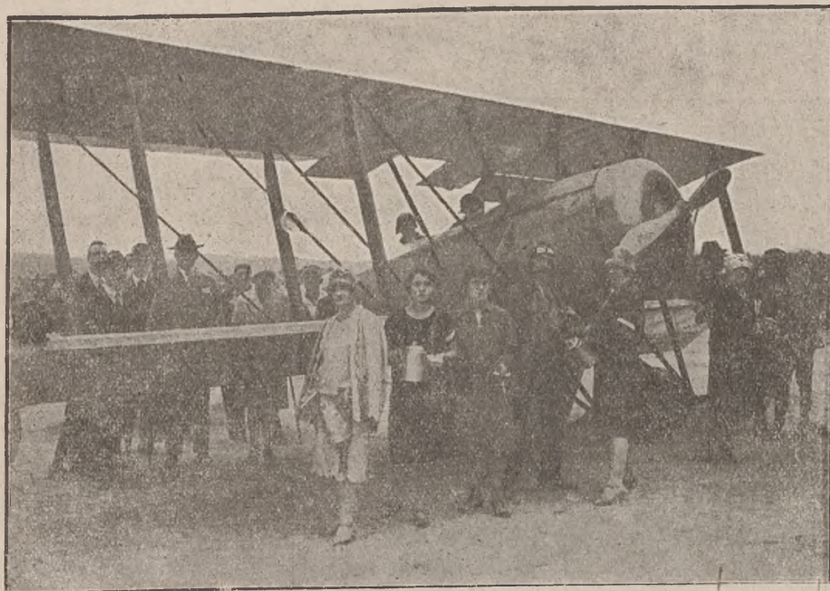
Na lotnisku w Katowicach, przy samolocie Hanriot H 28.

preze na cele lotnictwa jest duży, potrzeba działać ostrożnie i roztropnie. Niemniej powodzenie tych wyświetleń zachęca Komitet Kolejowy do dalszych w tym kierunku prób. Pamiętajmy, że w budowie naszego Państwa lotnisko najważniejsze zajmuje miejsce i że dla rozwoju tegoż potrzebne jest udoskonalenie wiedzy aerodynamicznej, potrzebna jest praca naukowa, doświadczalna, potrzebne są laboratoria tak na zachodzie rozpowszechnione a u nas prawie nieistniejące. W innych państwach