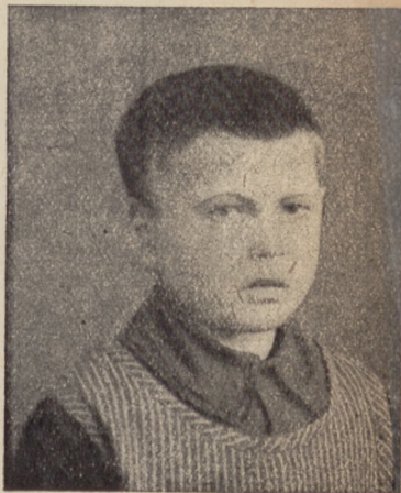
N. N. chłopiec głuchoniemy R. P. 20569/26.

L. 861. Warszawa, dn. 1 wca 1926 r. Poz. 99 i 100.