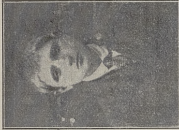
Poz. 82. Boćko Jan Nr. IV-45530-29.