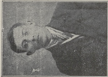
Poz. 50 i 51. Łapsza Justyn Nr. 10899 IV-30. Kl. 9 Ee dd li 2 li cd