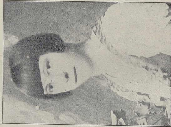
Poz. 84. Chmielówna Franciszka Nr. 27185-IV-30.