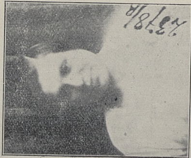
Poz. 42. Gierowska v. Górecka v. Góra Walerja Nr. 24970-IV-30.