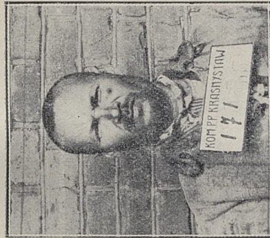
Poz. 95. N. N. umysłowo chory Nr. 26990-IV-30.