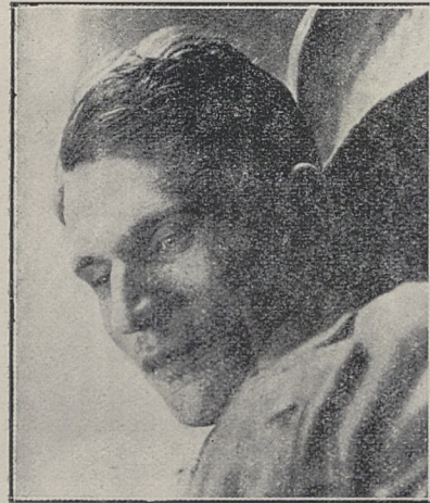
Poz. 94. N. N. trup mężczyzny Nr. 28782-IV-30.