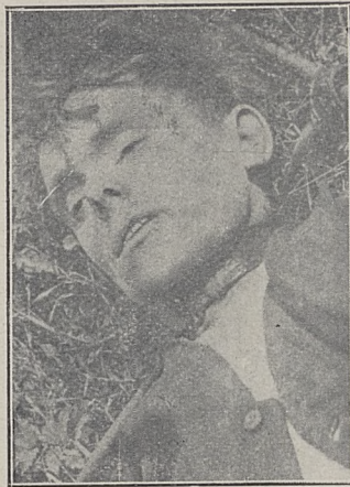
Poz. 96. N. N. trup mężczyzny Nr. 28218-IV-30.