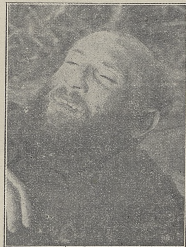
Poz. 92. N. N. trup mężczyzny Nr. 33419-IV-30.