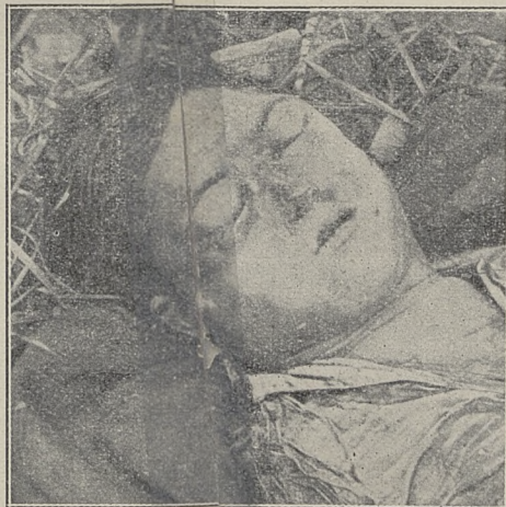
Poz. 91. N. N. trup mężczyzny Nr. 31004-IV-30.