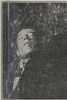
Poz. 104. N. N. trup mężczyzny Nr. 36378 IV-30.