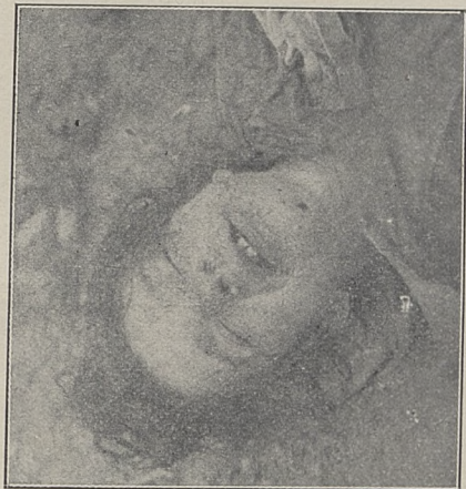
Poz. 91. N. N. trup kobiety Nr. 39847.IV-30.