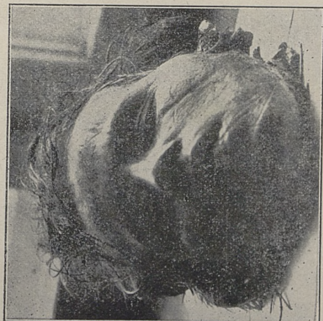
Poz. 90. N. N. trup kobiety Nr. 32082.IV-30.