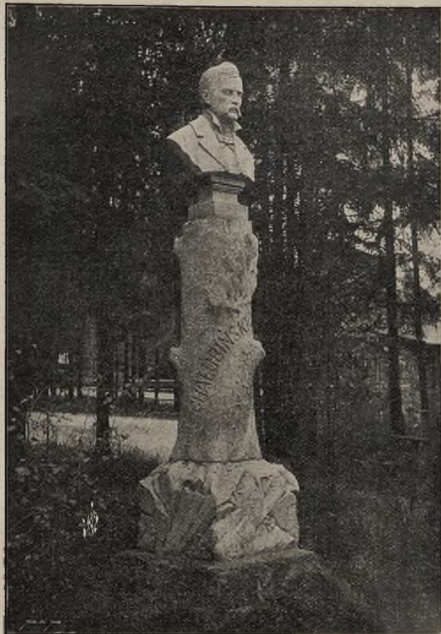
Pomnik prof. T. Chałubińskiego w parku Dra A. Chramca w Zakopanem.

Wszystkie te budynki, z przeważną częścią pokoju, zwróconych do słońca, tworzą zakład, stojący oddzielnie, zdala od zabudowań sąsiednich. Zakład jest ściśłym internatem, bo tylko taki może odpowiedzieć swemu zadaniu leczniczemu.