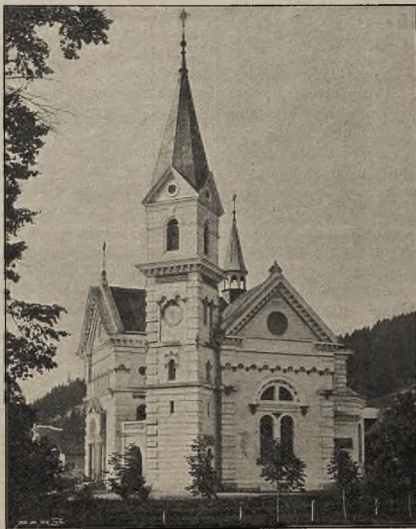
Kościół rzymsko-katolicki w Krynicy.