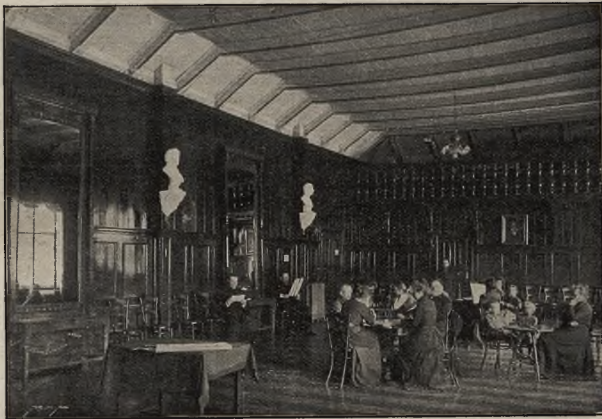
Czytelnia i sala zebrań w zakładzie Dra A. Chramca w Zakopanem.

Kraj uczynić to jednak może tylko wtedy, jeżeli będzie miał zupełną pewność: 1) że pożyczone pieniądze użyte zostaną istotnie na cele produktywnych inwestycji, 2) że sposób wykonania zamierzonych robót inwestycyjnych uczyni zadość wymaganiom leczniczym, sanitarnym i technicznym, wreszcie 3) że właściwej władzy zapewniona będzie wszechstronna kontrola przedsiębiorstwa. Powyż-