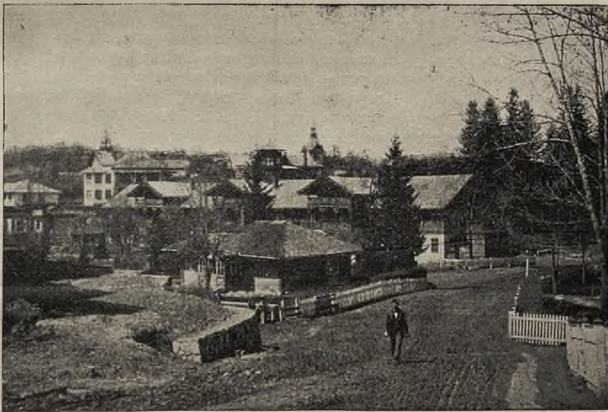
Widok ogólny Truskawca od strony południowej.

Członkiem Komisji nie może być osobistość, zasia-