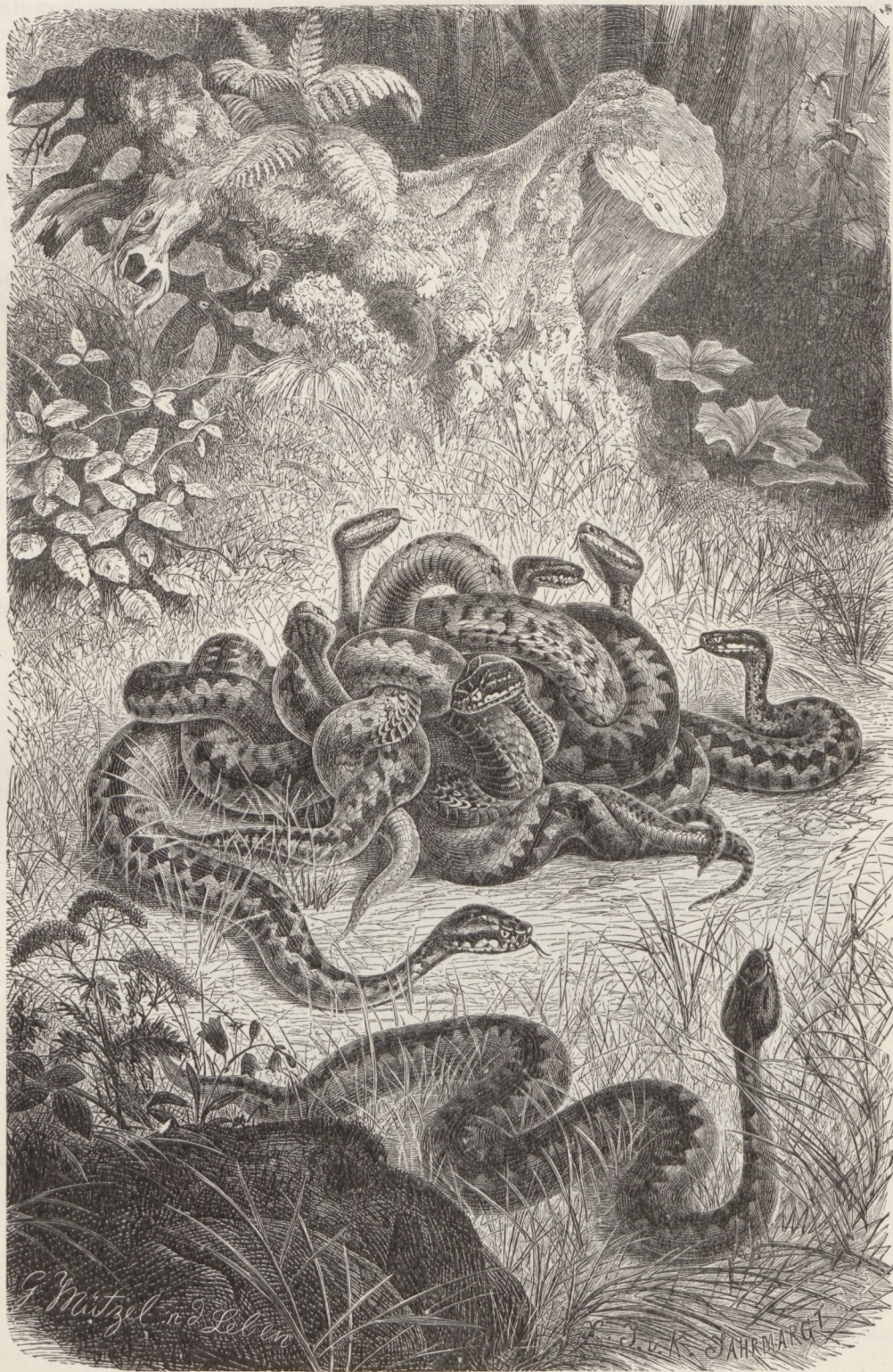
Fig. 1. ŻMIJA KRZYŻOWA.