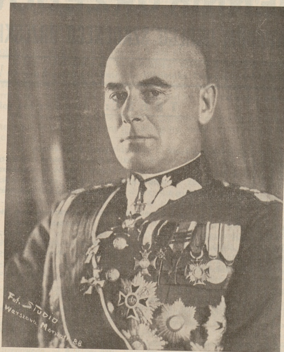
Marszałek Polski Edward Śmigły-Rydz.