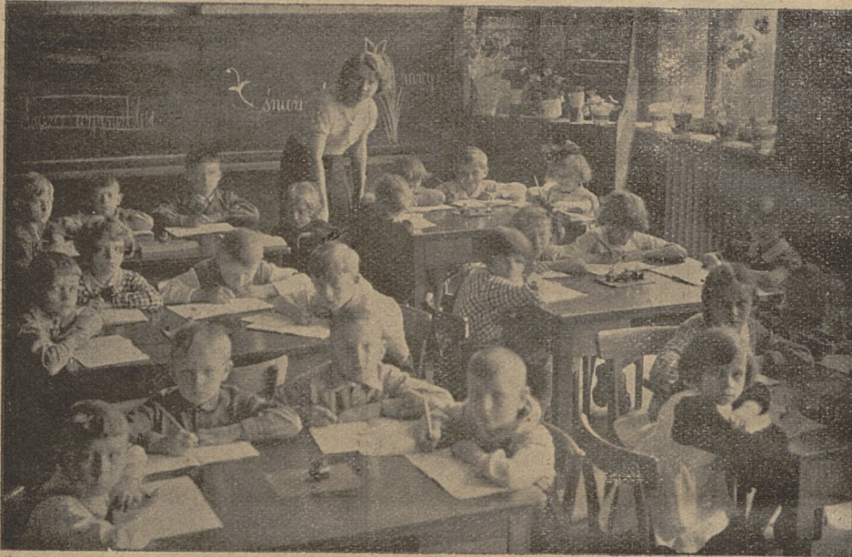
Klasa pierwsza w szkole nr. 17.