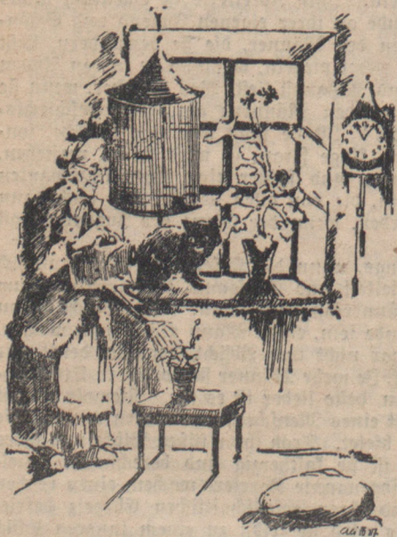
Jeden Morgen begoß Mate West ihre Blumen.

„Ein schöner Tag heute . . .“ lispelte das Marmelblümchen, und der kleine Vogel im Käfig, der selbstamerweisse Freundschaft mit dem alten Kater hielt, vielleicht weil das Vöglein im Käfig saß und somit unerreichbar wurde, zwitscherte: „Zip . . . zip . . . ein wunderschöner Tag!“ — „Heute ist Sonntag“, wisperte ein Kohlweißling, der vorübertaumelte, geheimnisvoll, . . . „drunten auf der Erde gehen die Menschen in die Kirche!“ — „Davon sehen wir nichts“, warf die Geranie bissig dazwischen, „also geht's uns nichts an.“ — „Sie sind immer so mißmutig!“ wagte jetzt das Marmelblümchen zu bemerken. — „Soll ich etwa nicht?“ — „Wir sind alle gefangen!“ philosophierte das Kanarienvögelchen. —