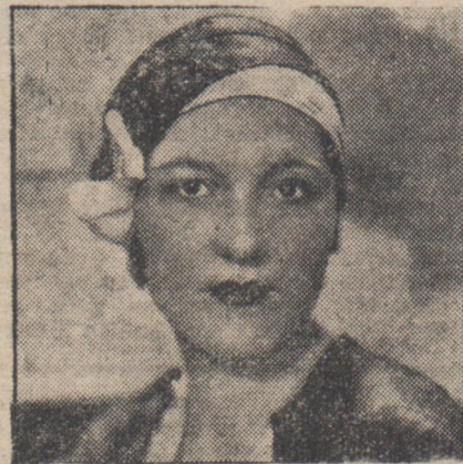
Kappe aus schwarzem Samt mit weißem vorgeheften Streifen und weißer Schleife.

des Hutes schräg heruntergezogen wird. Man muß diese neue Kappe vor dem Spiegel ausbalancieren und sie tief in den Nacken ziehen. Auch seitlich nicht zuviel Haare hervorschauen lassen, das paßt nicht für diese etwas herbe Kopfumrahmung. Und damit wir sie nur ja nicht verlieren —