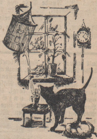
Das Trinknapfchen schwappte über und begoß die Blume.

Aber was sie alle dachten, es sollte sich ändern mit einem Schlag. Mate West wurde krank, und die alte Freundin, die zu ihr zog, sie zu pflegen, war eine herzlose Person. — Sie mochte weder Tiere noch Blumen leiden. — Kaum, daß sie dem Vögelchen sein Futter- und Trinknapfchen füllte, und das auch nur unpünktlich, kaum, daß der alte Kater satt zu fressen bekam; die Blumen auf dem Fensterbrett vergaß sie ganz. — „Oh, wie traurig sind wir!“ klagte das Marmelblümchen, und die Geranie seufzte: „Ach, wie . . . wie weit mag es bis zur Erde sein, aus der man uns loslöst und verschleppte?“ — Aber der Kater steckte seine Nase in die Höhe, er wollte dadurch sehr weise aussehen, und er miaute. — „Jedem das Seine, Fräulein . . . Meinen Sie denn, uns anderen geht's zum besten? . . . Ich habe durch den Türspalt gesehen, das alte Fräulein liegt im Bett, wenn es bloß bald wieder aufstehen wollte.“ — Aber es dauerte lange, zu lange, bis Mate West wieder gesund wurde. Da zog die schöne Geranie ihr brennend rotes Kleid-