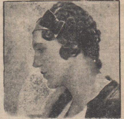
Kappe aus gezogenem braunen Samt mit beigefarbigem Ripsband und Schleife.

„Hut“ ist eigentlich zuviel gesagt. Denn was man uns diesen Herbst beschert, ist doch wohl nur eine „halbe Portion“. Ein Mittelding sozusagen zwischen Bastenmütze und Turban! Ein winziges Gewinde von Samt, Bändern, Filz, gewirkten, gestrickten Seiden- und Chenillefäden. Es sitzt auf dem