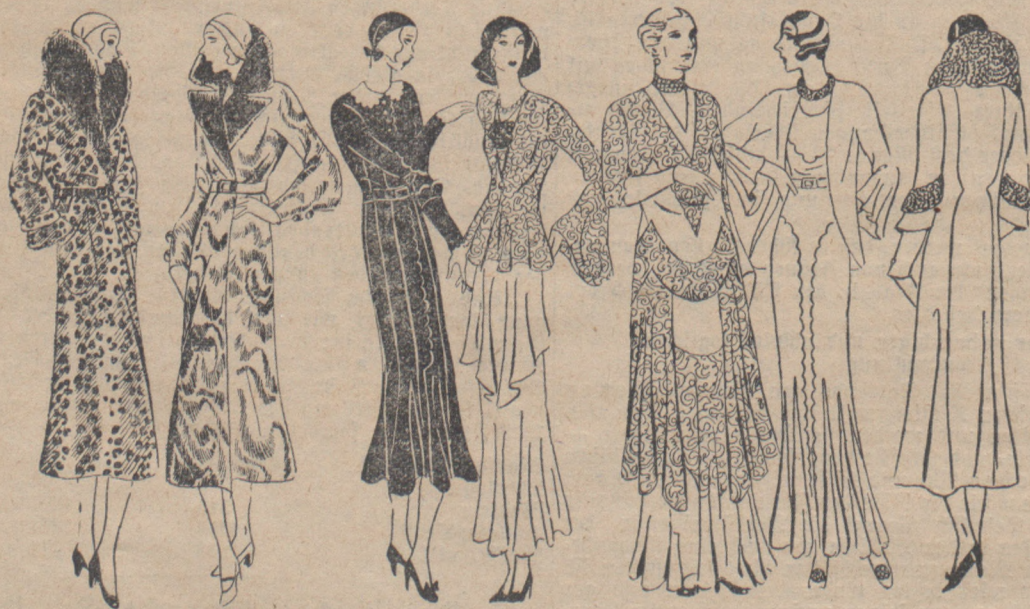
Die Mode für den Winter.

Ein sehr praktisches Geschenk ist ein Haartrockner. Die einmalige Ausgabe lohnt sich durchaus, denn dann kann man unbedingt auch im Winter das Haar zu Hause waschen, was nicht