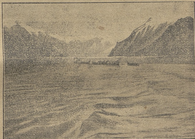
Die Einöde von Labrador

Im wesentlichen ist Labrador ein Hochplateau; längs der Nordostküste zieht sich ein hohes, wildzerklüftetes Gebirge mit Gipfeln bis zu 2700 Meter Höhe hin. Annähernd ein Viertel