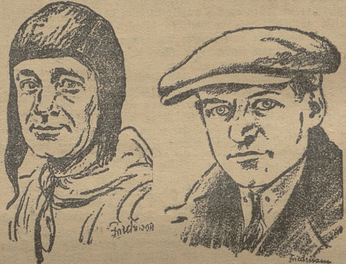
Die Nordpolflyer Wilkins und Eielson sind in Oslo eingetroffen und dort begeistert empfangen worden. Links: Kapitän Wilkins, rechts: Leutnant Eielson.

men konnte. Man erfuhr von der auffälligen körperlichen und geistigen Kräftigung zurückgebliebener Kinder nach längerer Einnahme bestimmter Medikamente, womit gleichzeitig eine Weiterentwicklung der Kapillaren in der Richtung auf die Norm erfolgte. Wer aber geglaubt hat, daß damit nun endlich der heiß ersehnte „Münchberger Trichter“ gefunden sei, mußte sich sagen lassen, daß derartige Fortschritte nur in wenigen Fällen und keineswegs in allen Gegenden Deutschlands zu erzielen waren, so daß, wie so oft, der Wissenschaft nichts übrigbleibt, als, nach dem Abklingen des ersten Begeisterungsrausches über die neuen Erkenntnisse, in ruhiger, geduldiger Forscherarbeit die neue Methode auf ihre Brauchbarkeit hin zu prüfen und die gewonnenen Ergebnisse mit aller Vorsicht zu verwerten.