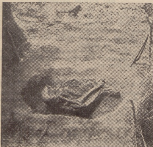
Das Skelett an seiner Fundstelle. Aus: Reck, „Oldoway, die Schlucht des Urmenschen“. Mit Genehmigung des Verlags F. A. Brochhaus, Leipzig.

Ausgrabungen am Tendaguru im Süden der Kolonie bereits bekannt, betraut wurde. Zugleich sollte er die noch kaum bekannten geologischen Verhältnisse der großen ostafrikanischen Bruchstufe sowie die Vulkanriesen und -zwergie ihrer weiteren Umgebung erforschen.