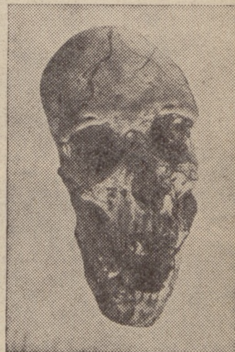
Der Schädel des Oldoway-Menschen. Aus: Reck, „Oldoway“. Mit Genehmigung des Verlags F. A. Brochhaus, Leipzig.

Tiere an und tötete sie, oder er zog aus, um Wurzeln zu graben und Fallgruben auszuheben. Auch die Kunst des Fischfangs kannte er schon. Der Mensch von Oldoway ist also ein höher entwickeltes Wesen als der Neandertaler, dessen geringere geistige Eigenschaften von seinem rohen Schädelbau verraten werden; der Typ des Oldoway-Schädels weist auf asiatische Rassen hin. Wer sich für die Entwicklungsgeschichte der Menschheit interessiert, dem wird das Buch Professor Recks „Oldoway, die Schlucht des Urmenschen“ (Brochhaus, Leipzig) ein Erlebnis bedeuten.