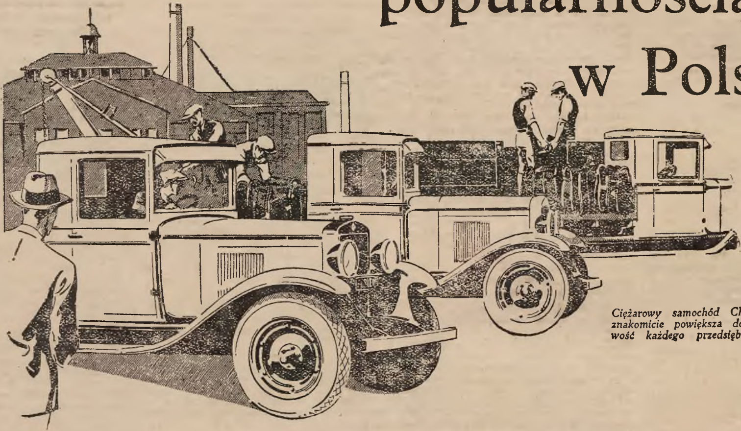
Ciężarowy samochód Chevrolet znakomicie powiększa dochodowość każdego przedsiębiorstwa

Jako niezawodny środek transportowy, przeznaczony do pracy w najróżnorodniejszych warunkach drogowych w Polsce, nowa ciężarówka Chevrolet posiada 6 cylindrowy silnik, idealnie odpowiadający temu celowi.