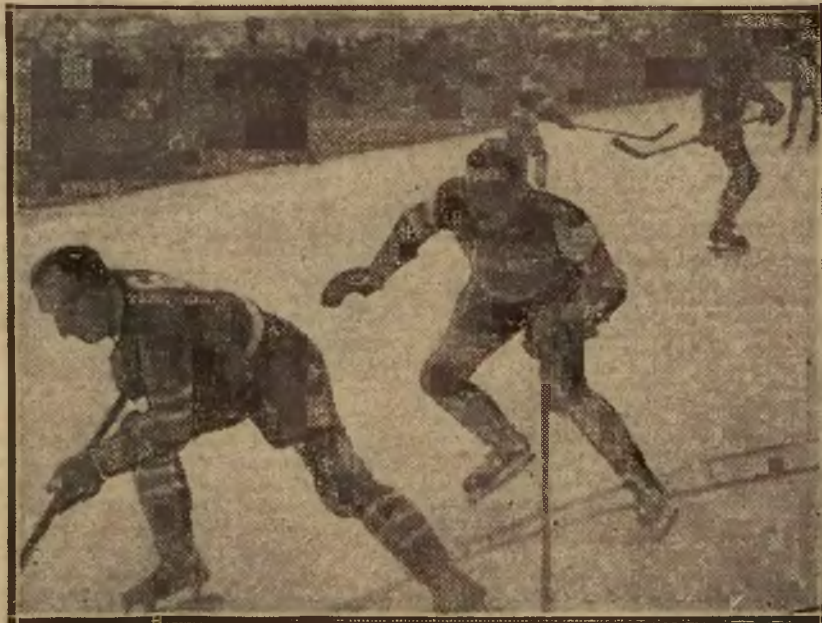
PIECHOTA (D) MINAŁ CZARNIKA (CR) w czasie meczu Cracovia — Dąb 1:1 w Krakowie.