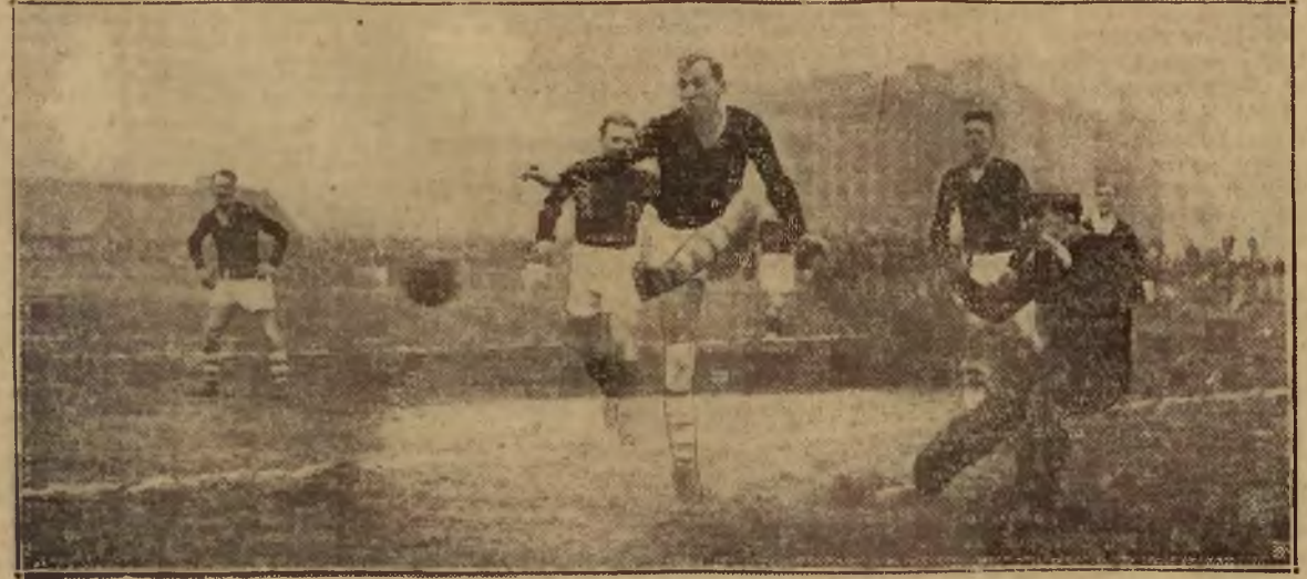
POLONIA — UNION TOURING 3:1

Toruń Wilno Równe Katowice eliminują 32 finalistów mistrzostw Polski