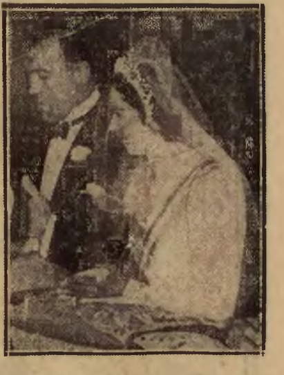
CARNERA OŻENIŁ SIĘ Olbrzymi bokser włoski Primo Carnera, który zrezygnował z kariery na ringu — zaczyna nowe życie, jako... małżonek

„Rumuni” przysła do Polski lekkoatletów (panie i panowie), 4-ch pływaków, 2 pływaczki, kilku bokserów, drużynę piłki nożnej i zespoły gier sportowych.