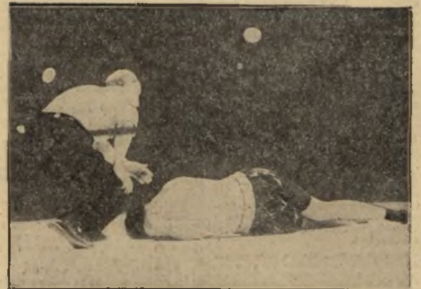
TAK STRACIŁ BRADDOCK MISTRZOSTWO ŚWIATA w ósmej rundzie meczu z Lousem