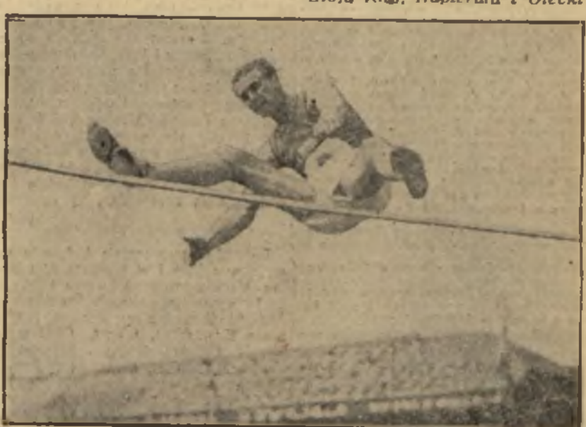
ZWYCIĘSKI SKOK KOTKASA Ołbrzymi Finlandczyk przekroczył lekko wysokość 197 cm w Antwerpii.