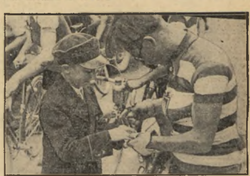
NA TRASIE Wandor rozdaje autografy