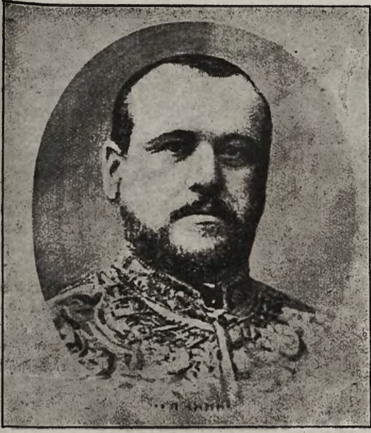
Zamach stanu w Rosji: Prezes rewolucyjnego komitetu wykonawczego, prezydent Dumy M. Rodzianko.