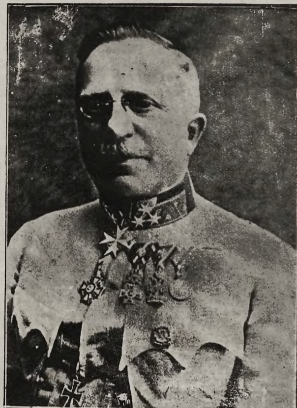
Zmiany na kierujących stanowiskach: J. E. generał piechoty, Artur v. Arz, szef sztabu jeneralnego armii austriacko-węgierskiej.