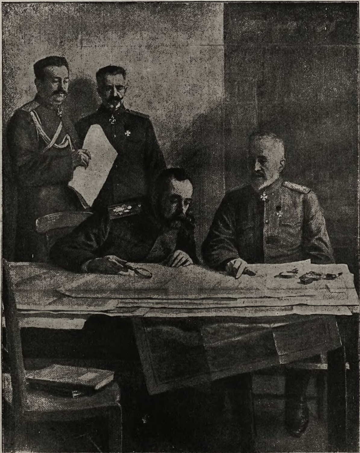
Zamach stanu w Rosji: Zdetronizowany car Mikołaj z wielkim księciem Mikołajem Mikołajewiczem w głównej kwaterze.

Komitet wykonawczy oparł się na ludności stolicy, która podniosła bunt i na garnizonie Petersburga, który, w sile przeszło 50 000 żołnierza, połączył się w zupełności z powstańcami.