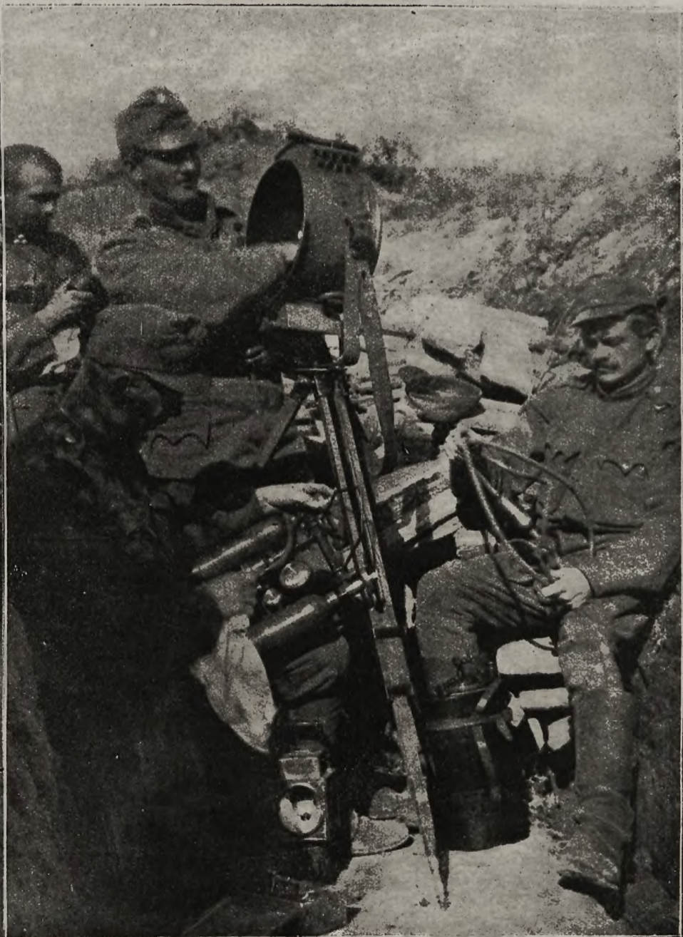
Z frontów bojowych: Naprawa reflektora w rowie strzeleckim na północnym froncie.