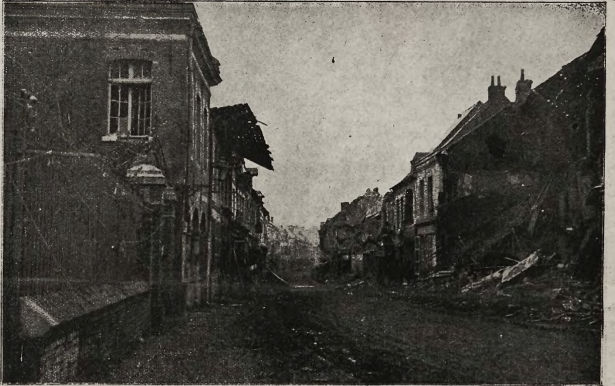
Z frontów bojowych: Główna ulica w Bapaume na zachodnim froncie.

narodowi ułatwić ściśle i spójnie i organizację wszystkich jego sił dla urzeczywistnienia zwycięstwa.