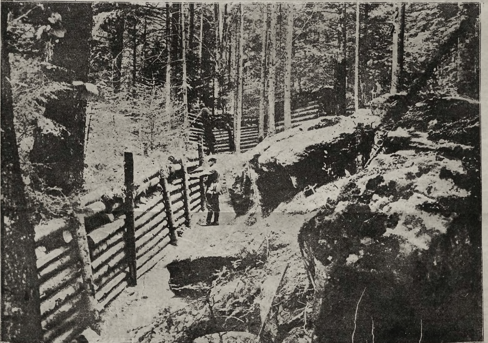
Z frontów bojowych: Obwarowania niemieckie w skalistym terenie w Wogezach.

Podobnych scen jest więcej. Może nawet panie, odwiedzające chorych, nie zdają sobie sprawy, jak wielką im ulgę przynoszą, choćby tylko ciepłem, czułem słowem. W chaosie wojennym często niedoceniamy, jak wielką rolę samarytańską spełniają