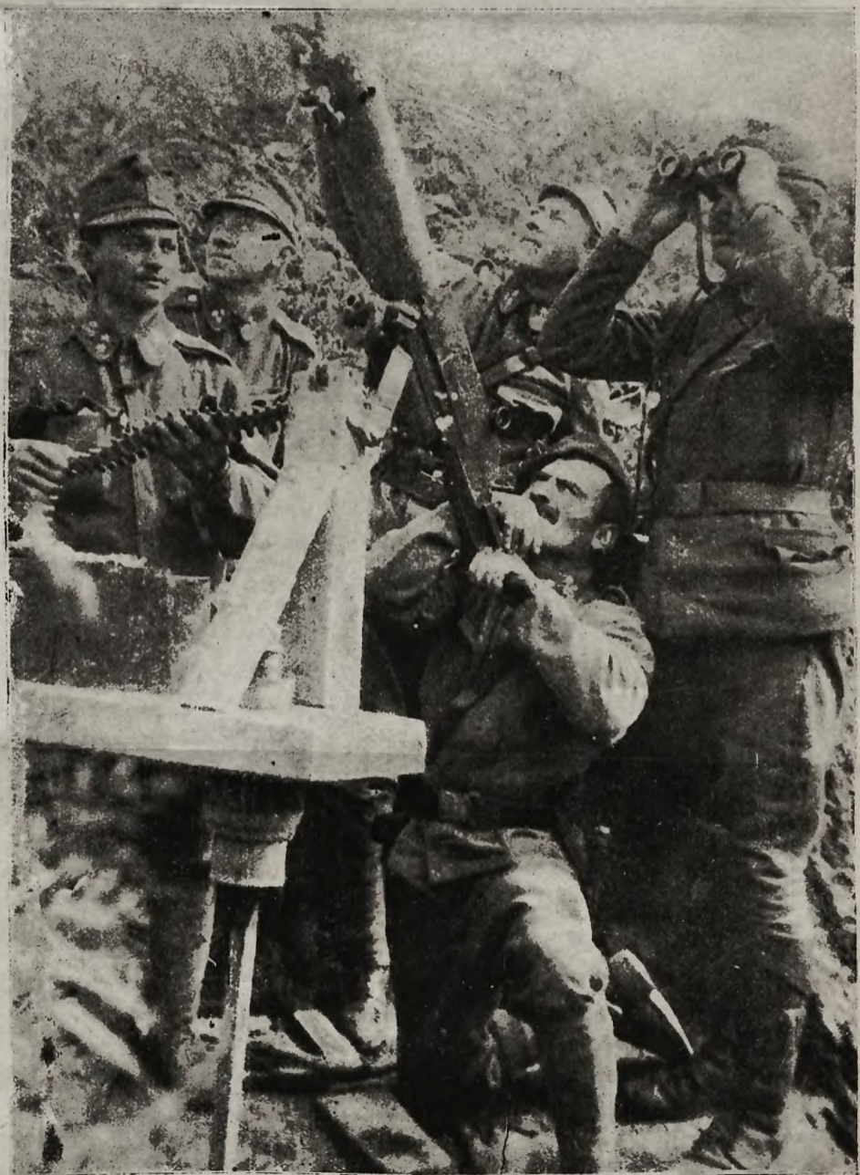
Z frontów bojowych:

Wyrzucanie granatów ręcznych z austriackiego rowu strzeleckiego na rumuńskim froncie.