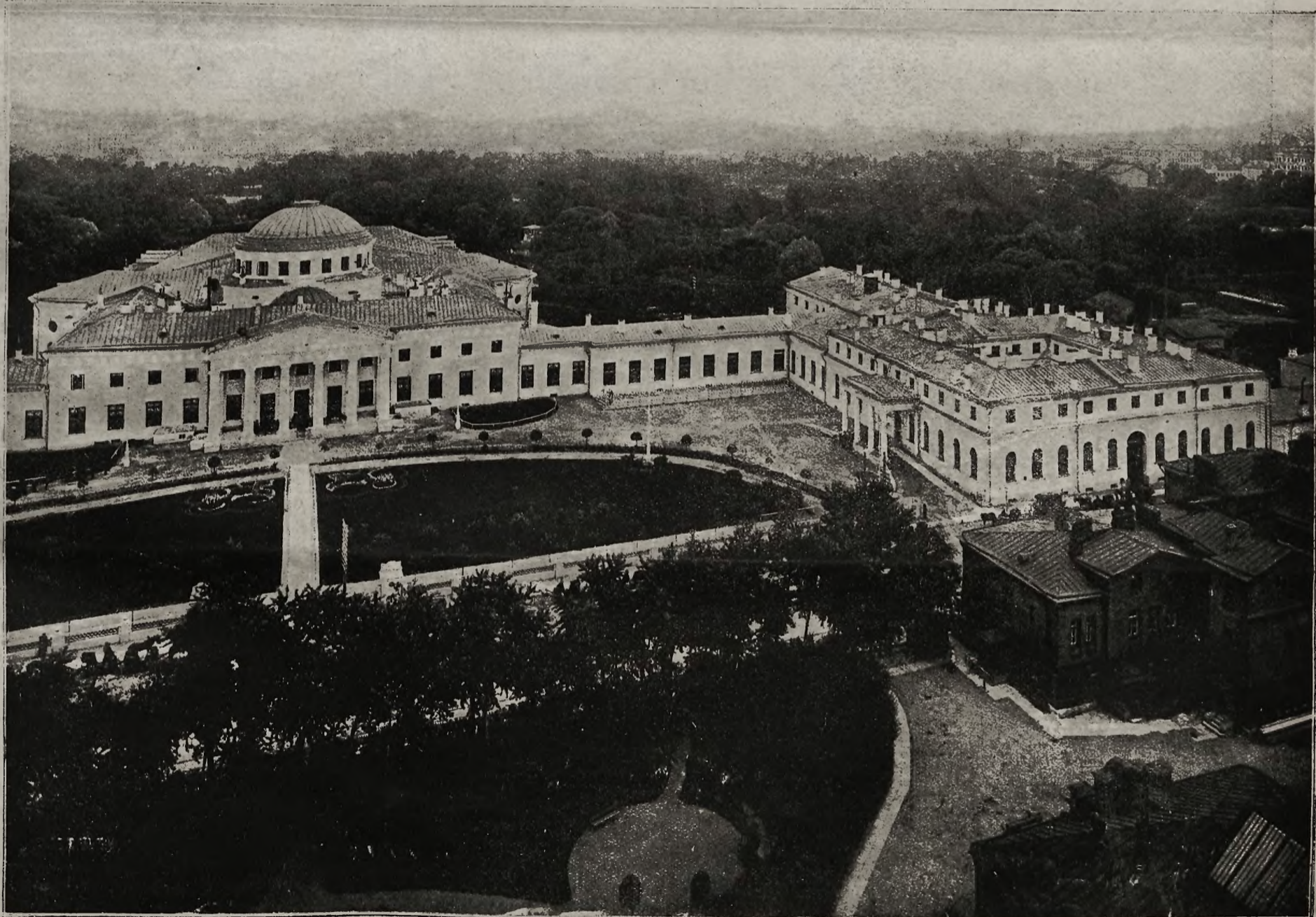
Ogólny widok na siedzibę Dumy w Petersburgu, pałac Taurydzki, w którym po zamachu stanu internowano aresztowanych ministrów.

Treść numeru: Zmiany na kierujących stanowiskach. — Praca przygotowawcza w Legionach. — Z frontów bojowych. — Kobiety plotrkowskie — Legionistom i t. d.