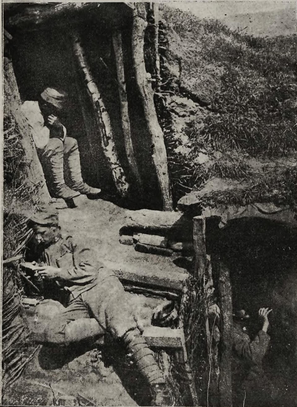
Ziemianki austriackich żołnierzy na rosyjskim froncie.

Ocejmując urzędowanie, zaznaczył wyraźnie nowy komendant, że życzliwie odnosić się będzie do spraw miasta i ludności cywilnej i w miarę możliwości uwzględnić słuszne jej żądania i potrzeby.