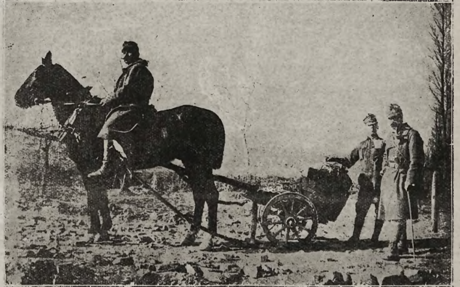
Z frontów bojowych: Dowóz żywności do okopów nad Soczą.

cza swą działalność. Poza różnemi świadczeniami, niosącymi ulgę i pomoc naszym żołnierzom w polu, czy w przejeździe znajdującym się w Piotrkowie, jedną z jej poważniejszych czynności jest niesienie pomocy Legionistom, leczącym się w szpitalu.