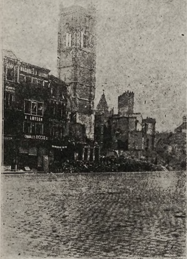
Z frontów bojowych: Kościół w Peronne, zniszczony francuskimi granatami.

Jaką wagę militarną może mieć owo zdarzenie, orzekną znawcy zawodowi. W każdym razie front mezopotamski leży zbyt daleko poza głównymi ogniskami wojny światowej, by zdołał oddziaływać na sytuację wojenną w Europie.