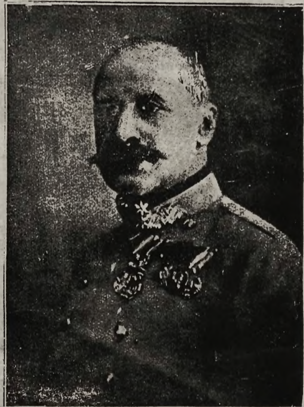
Zmiany na kierujących stanowiskach: J. E. generał kawaleryi, hr. Karol Huyn, nowoimanowany namiestnik Galicyi

W dniach wielkiej walki przeciw zewnętrznemu nieprzyjacielowi, który od trzech lat stara się ujarz-