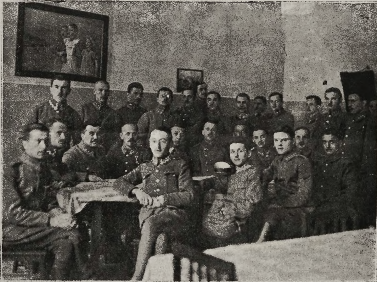
Praca przygotowawcza w Legionach: Szkoła administracyjno-gospodarcza.

Nakoniec w obozie ćwiczeń rozlokowała się Ko-