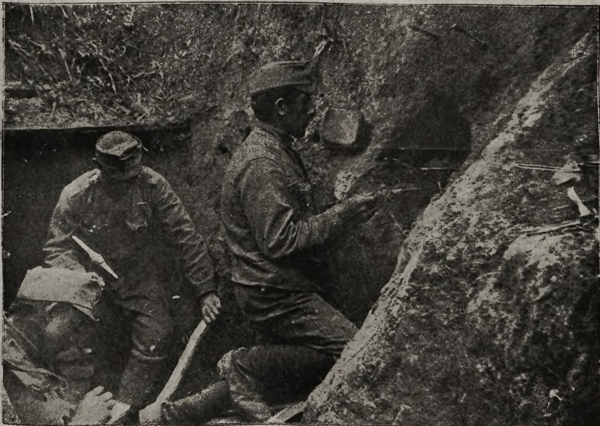
Z frontów bojowych: Prowizoryczna kuchnia polowa w rowie strzeleckim na wschodnim froncie.