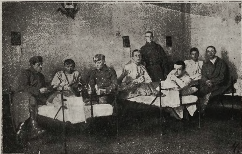
Odwiedziny towarzyszków w szpitalu dla Legionistów w Piotrkowie.

Do szkoły oficerskiej niższej przeznaczono 90 żołnierzy i podoficerów, oraz kilku oficerów, którzy dawniej na etacie sztabowym awansowali, a teraz przeniesieni być mają do linii. Materiał, jaki do tej szkoły wszedł, nie pod każdym względem odpowiada normalnym wymaganiom. Trzymano się jednak za-