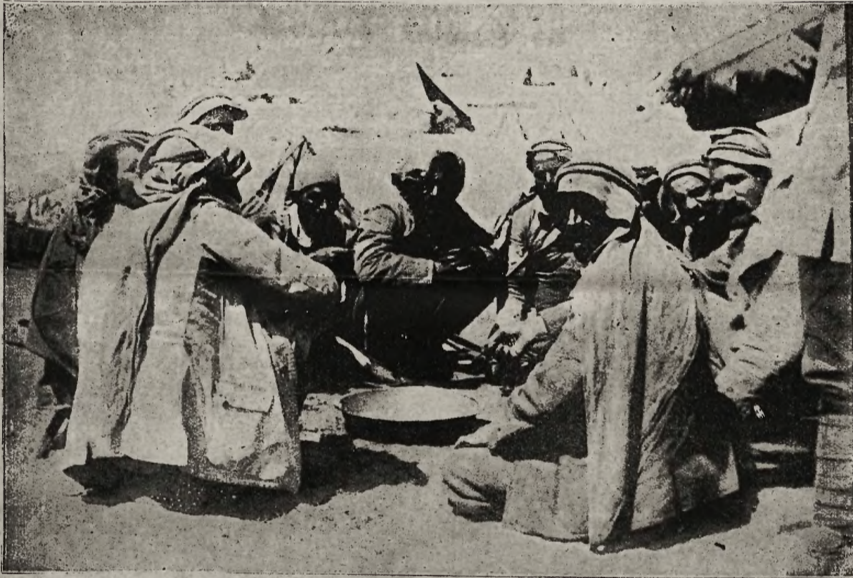
Z frontów bojowych: Obóz tureckiej piechoty w dolinie Tygrysu

Za ten niespodziewany przewrót w Rosji został dokonany przy poparciu państw koalicyjnych najlepiej świadczy fakt, iż zastępcy Anglii, Francji i Włoch w kilka dni załdnie po dokonaniu zamachu stanu uznali nowy rząd rosyjski.