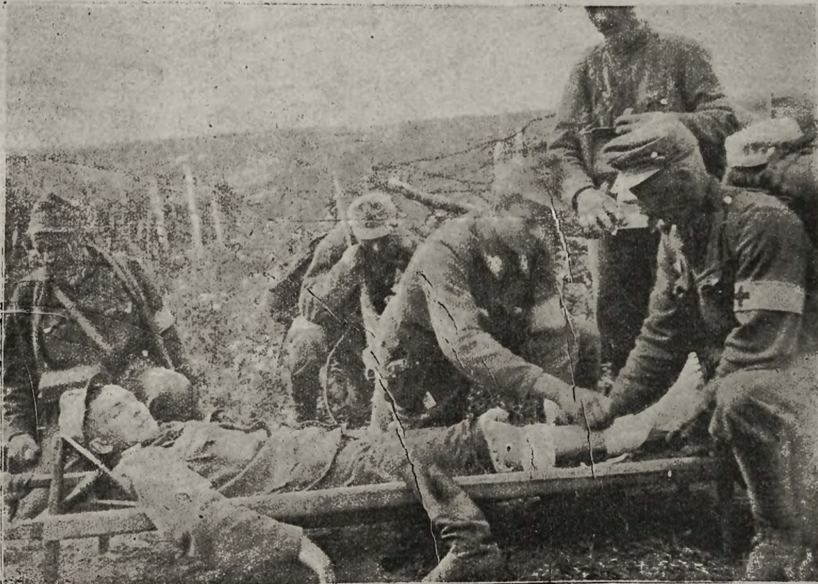
Z frontów bojowych: Zakładanie rannym żołnierzom pierwszego opatrunku na polu bitwy.

Najważniejszym wydarzeniem militarnym ostatnich dni było zajęcie Bagdadu przez Anglików. Ocena tego zdarzenia wojennego nie jest zadaniem łatwym. Chodzi tu bowiem o wypadki na bardzo odległych i mało znanych przestrzeniach. Akcja bojowa w Mezopotamii odgrywa się niejednokrotnie wśród miejsc, których napróżno szukaćby na kartach geograficznych. Niemniej jednakże kampanii w Mezopotamii przypada ważna rola. Najlepszym dowodem okoliczność, że Anglia i Rosja zamierzały, a nawet dotąd układają sobie akcję koncentryczną, by wejść w ziem tych