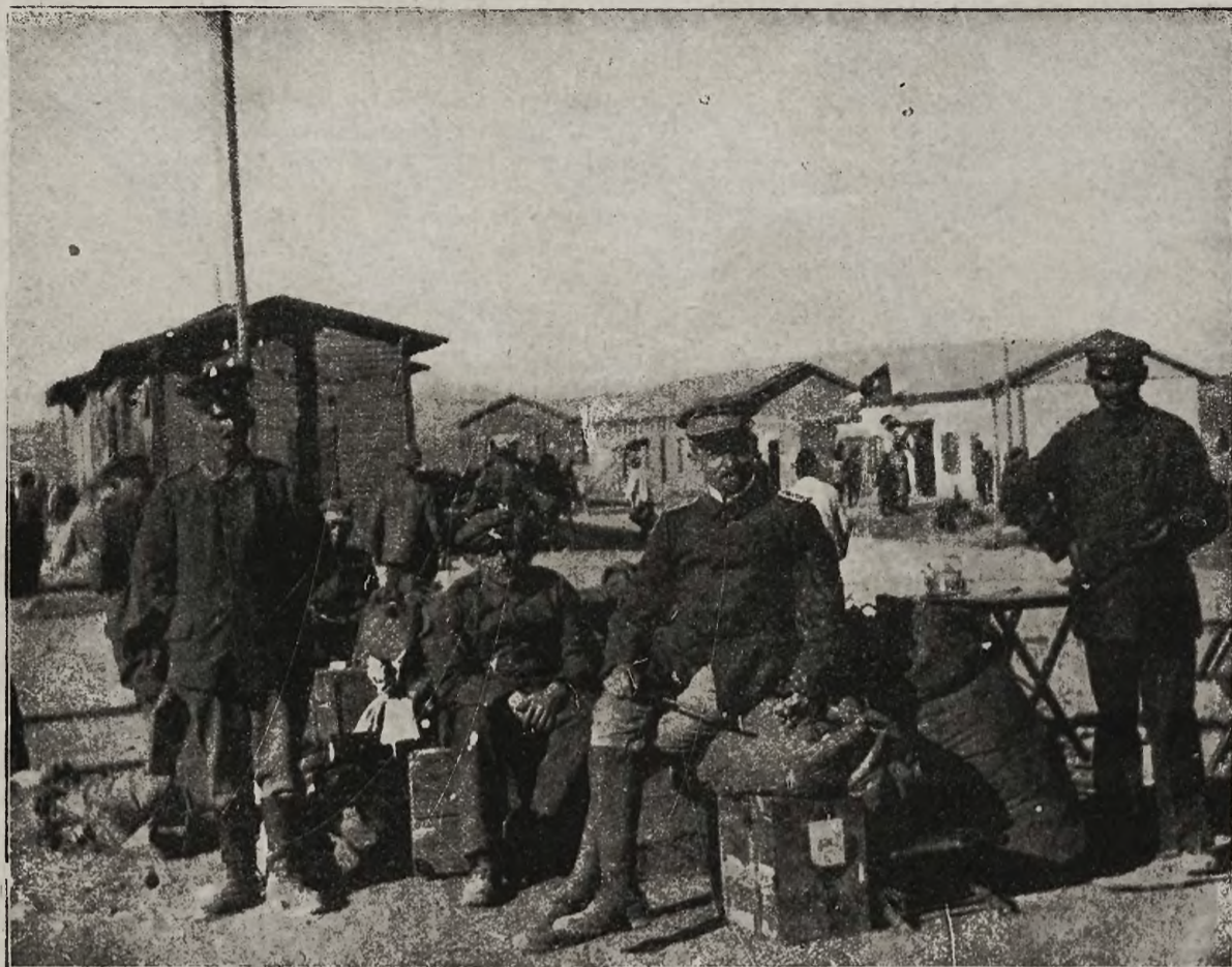
Z frontów bojowych: Odpoczynek niemieckich żołnierzy na jednej ze stacji kolei bagdadzkiej

wojnie. Przy powstrzymaniu rosyjskiej ofensywy na linii Tarnów—Limanowa—Gorlice korpus jego odegrał bardzo ważną rolę i przyczynił się głównie do pobicia nieprzyjaciela, poczem ścigał cofającą się armię aż pod mury Brześcia Litewskiego. Z kolei rzeczy, już jako komendant armii, spisał się dzielnie generał Arz na froncie rumuńskim.