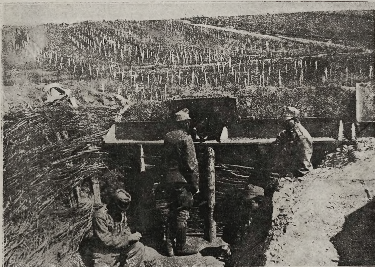
Z frontów bojowych: Pozycja austriacka na północnym froncie, chroniona zasiekami z drutu kolczastego.

raport w kompaniach, batalionach i w komendzie pułku. Od 12 2 po południu obiad. Od 2 3 ćwiczenia w polu. Od 3 6 wkłady w koszarach, prowadzone przez oficerów legionowych i instruktorów niemieckich. Od 6 7 wieczorem naprawa żołnierskich rzeczy, umundurowania i t. d. O godzinie 7 kolacja. Od 7-9 wolne, o godzinie 9 układanie się do snu.