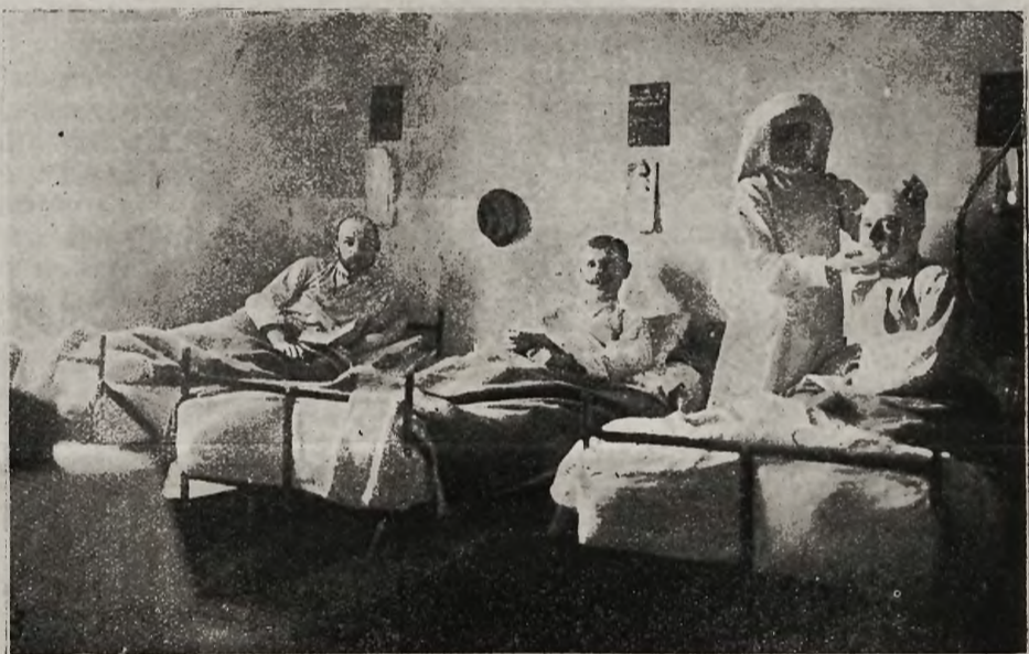
Jedna z sal szpitala dla Legionistów w Piotrkowie.

nasze Polki, zorganizowane w Lidze Kobiet, niosącej pomoc żołnierzom polskim. Kiedyś historia nie pominie tych zasług.