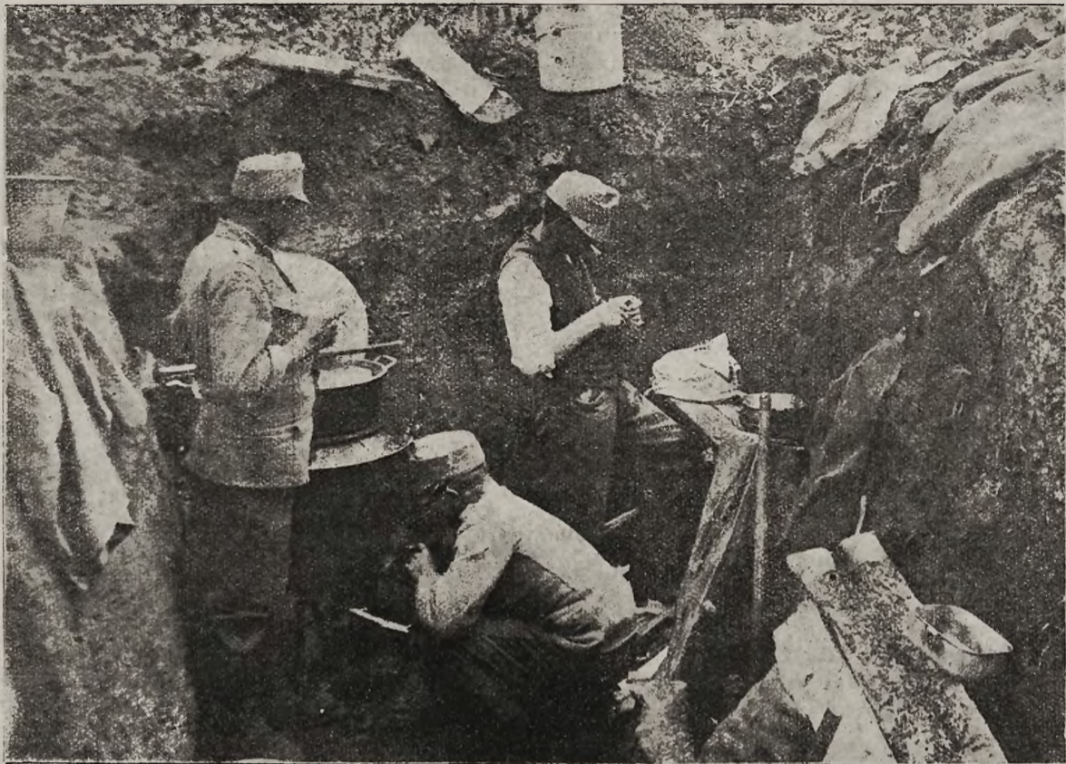
Z frontów bojowych: „Kuchnia polowa” w rowie strzeleckim na wschodnim froncie.