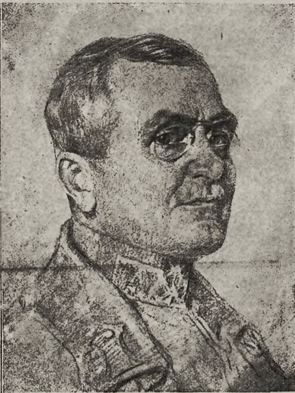
Zmiany na kierujących stanowiskach: J. E. marszałek polny porucznik Oskar Gusek Edler von Glänkirchen, komendant twierdzy w Krakowie.

„Wobec ciężkiego położenia i groźnych nieporządków, które zawiązujemy polityce dawnego rządu, widzi się komitet wykonawczy zmuszony ująć w swe ręce publiczny porządek. W pełnej świadomości odpowiedzialności za powyższe uchwały, wyraża komitet wykonawczy przekonanie, że ludność i wojsko będą mu w ciężkim zadaniu pomagały przy utwo-