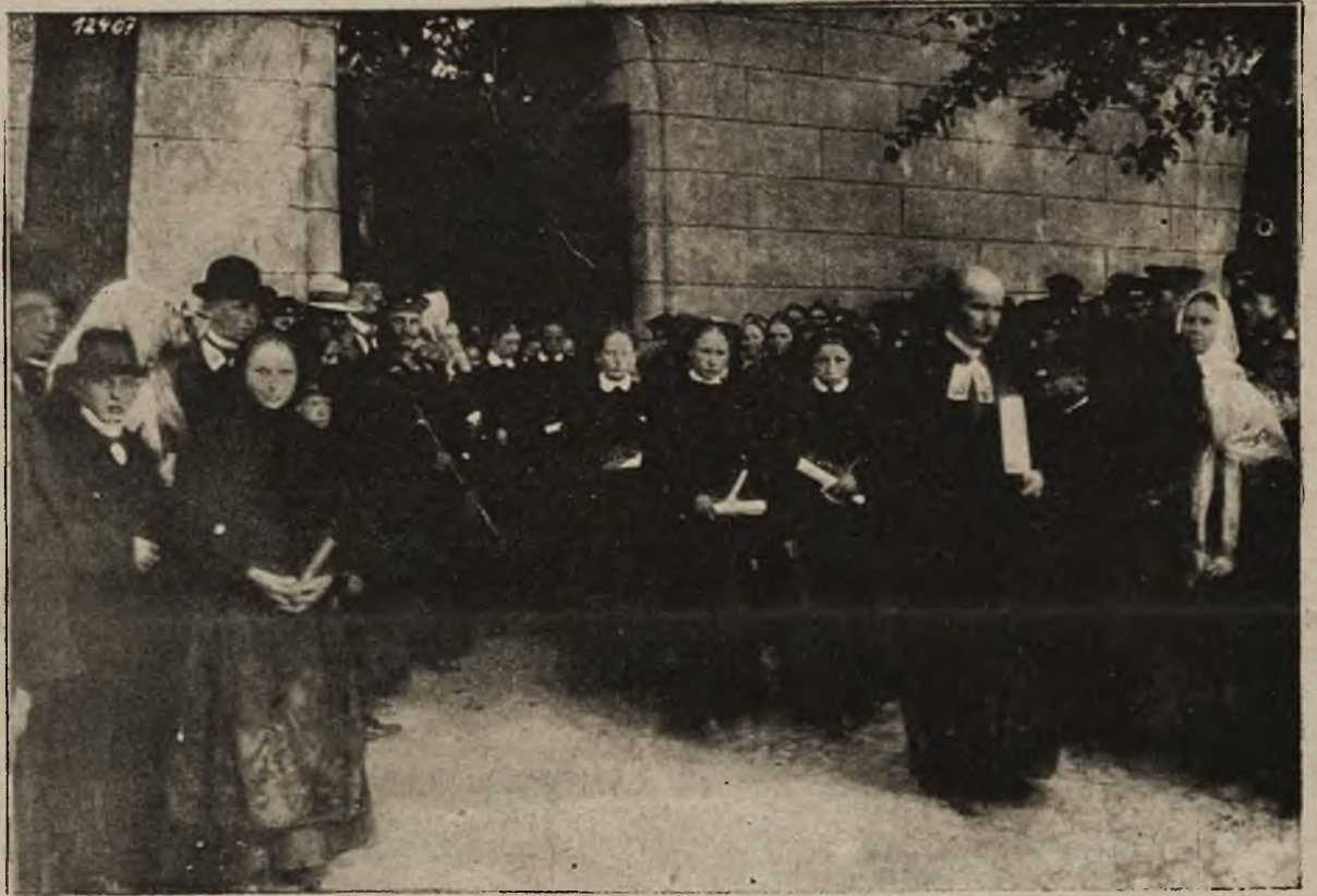
Na Kresach Rzeczypospolitej polskiej: Uroczystość kościelna na Litwie

Rada miasta Krakowa powzięła uchwałę zbudowania nowego gmachu w dniu 17 czerwca 1886 r. Większością dwóch głosów przyjęto wniosek ś. p.