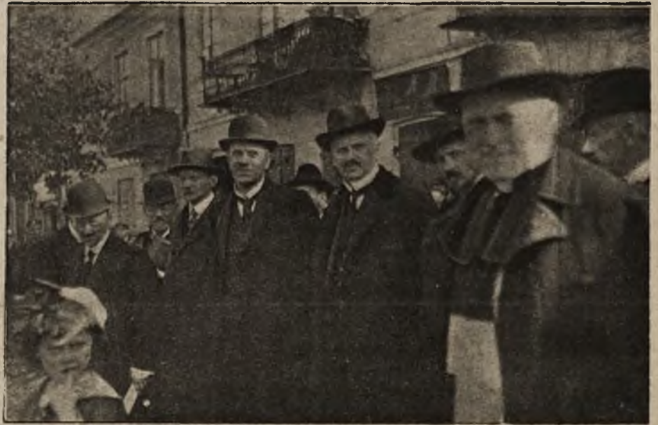
Uroczystości narodowe w stolicy Podlasia: