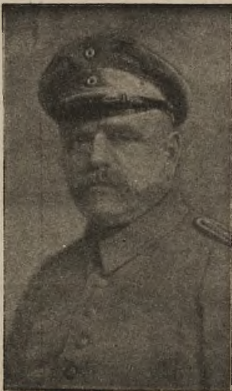
Nowy rząd niemiecki: Pres. Giesberts, podsekretarz stanu

Dla upamiętnienia obchodu dyrekcyja wydała ozdobny afisz pamiątkowy w postaci jednolitej.