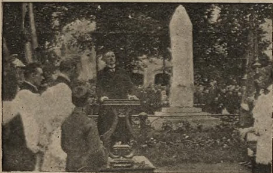
Odsłonięcie pomnika Kosińskiego w Siedlcach.

Od nowego rządu oczekuje większość społeczeństwa niemieckiego, nie zaślepiona szowinizmem narodowym, uzyskania honorowego pokoju i zaprowadzenia nareszcie ładu w Europie.