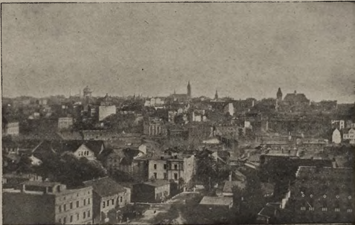
Walki w Poznańskim: Ogólny widok Zabrza

Podajemy szereg ilustracji z Poznania i okolicy.