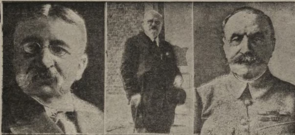
Reprezentacja konferencji pokojowej: Delegaci francuscy na konferencję: Min Pichon Leon Burgeois Marszałek Foch

Zjednoczone: Wilson i Lansing. Włochy: Orlando i Sonnino. Obecny był również marszałek Foch. Rada naczelna zastanawiała się nad przedłużeniem rozejmu i nad nowymi warunkami które mają być przedstawione przez Focha delegatom niemieckim. Następną konferencją sprzymierzonych składają się już będzie tylko z prezesów ministrów i ministrów spraw zagranicznych wielkich mocarstw. Przystąpi ona do badania metod i procedur przedwstępnych rokowań pokojowych.