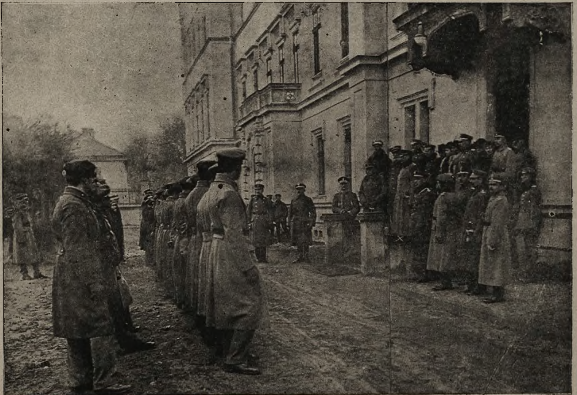
Podniesienie szkoły podchorążych w Łobzowie: Przemowa generała Gologórskiego (X) do podchorążych.

usunęła wojskowość. W innym miejscu panienka wstaje z łóżka i przyczesuje przed zwierciadłem włosy. W tem ogłusza ją straszny gizmot, a równocześnie obsypują ją i pokój cały, niby płatki śniegu. To granat upadł na poduszkę, na której spoczywała przed chwilą główka panienki i próżno z rozzerwania pościeli, nie wyrządził żadnej szkody. To znowu rodzina siedzi w jadalni, w tem do salonu wpada granat z sykiem straszny, niby „bąk“ wiruje po podłodze, omotuje się w dywan i nie eksplodowawszy, leży tam dotychczas na pamiątkę cudownego ocalenia. W innej stronie miasta granat uderza w okno i wywala go wraz z ramami i futrynami. Wewnątrz salonu prócz zbitego cylindra u lampy, żadnej szkody. Tak trwa Lwów, co dnia ponosząc nowe ofiary.