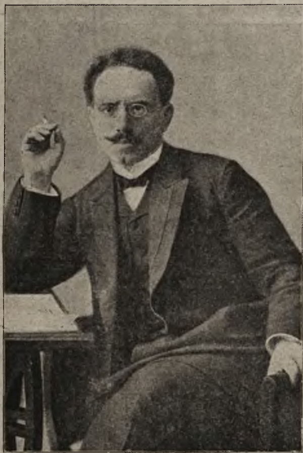
Wzika z bolszewizmem w Niemczech: Przywódca bolszewików Liebknecht, zabity w Berlinie.

a stojący pustką od śmierci właściciela. Lecz wprzód odbywają się bankiety na cześć głów koronowanych, usunięto z pałacu kosztowniejsze meble zmarłego przez co przybędzie jeszcze 40 miejsc.