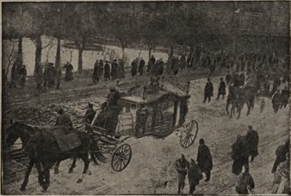
Pogrzeb trzech ofiar ukraińskich granatów rodziny Mięśowiczów.

szeregi opisów takich faktów. Przytaczamy kilka: Do izby wlatuje granat, przebiwszy okno i wpada na łóżko, w którym pod pierzyną spi staruszka. Przerażona łoskotem, zrywa się kobiecina i niemieje z przerażenia. Na pościeli leży duży stożkowaty przedmiot — niewystrzelony granat, który następnie