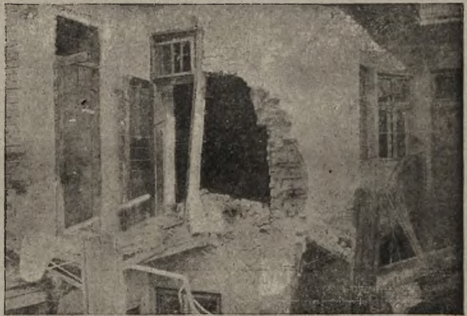
Lwów pod ogniem dział: