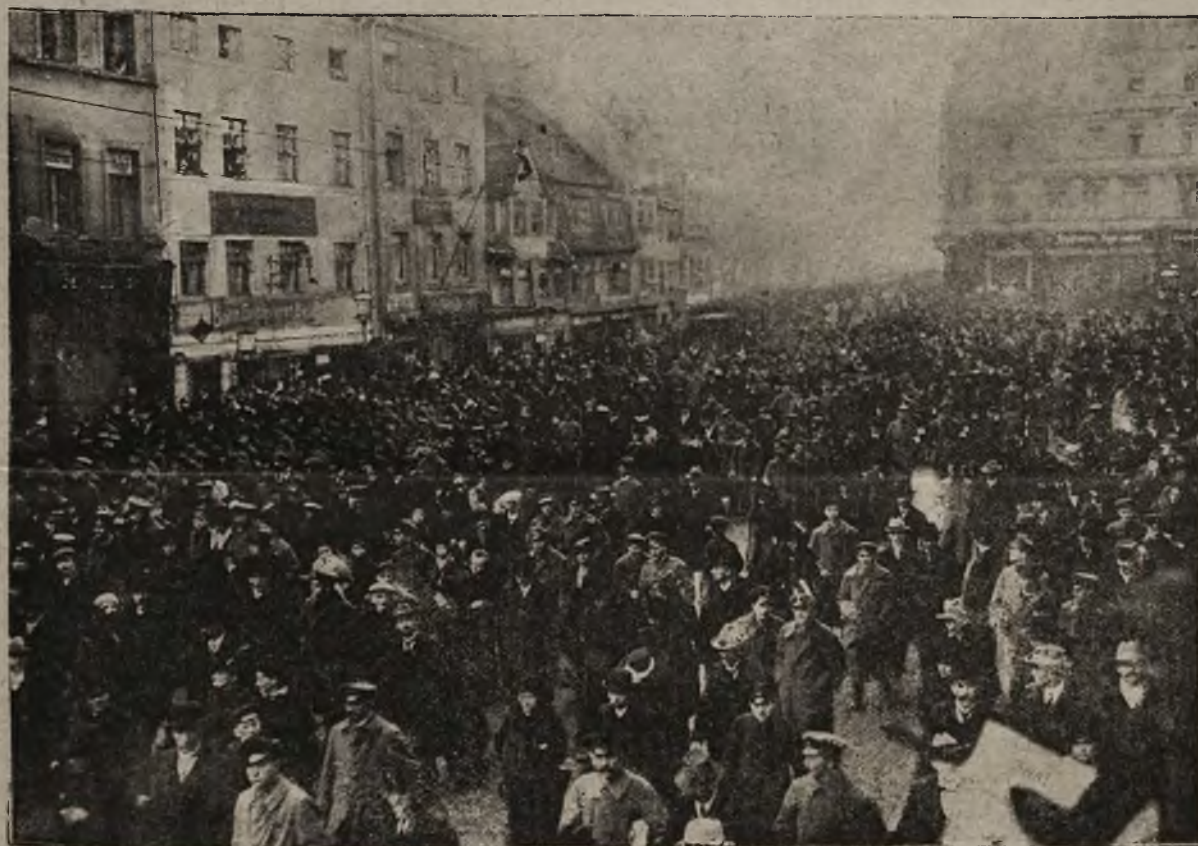
Walka z bolszewizmem w Niemczech: Demonstrujący w Lipsku spartakiści na rzecz rewolucji bolszewickiej