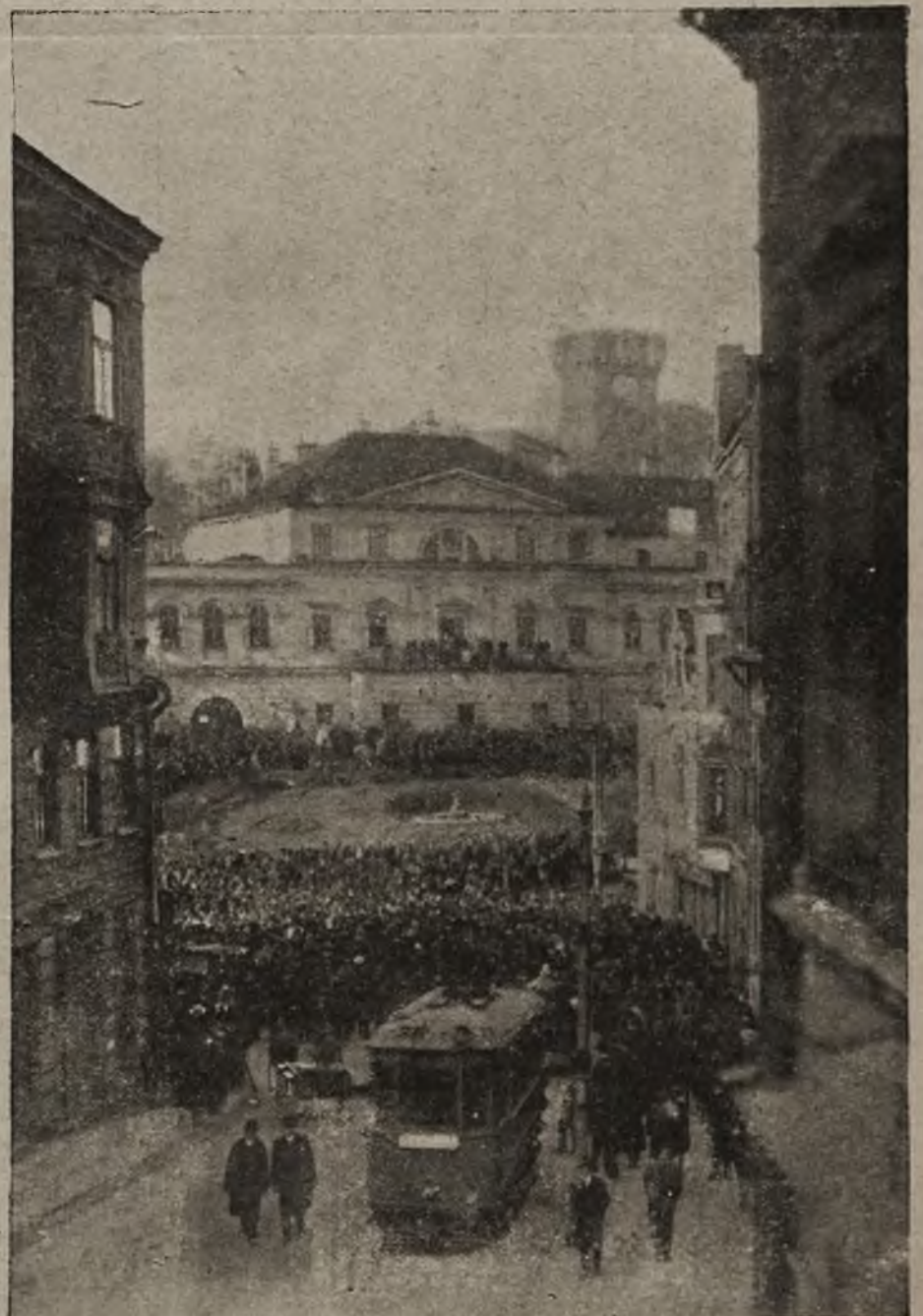
Słask Cieszyński dla Polski: