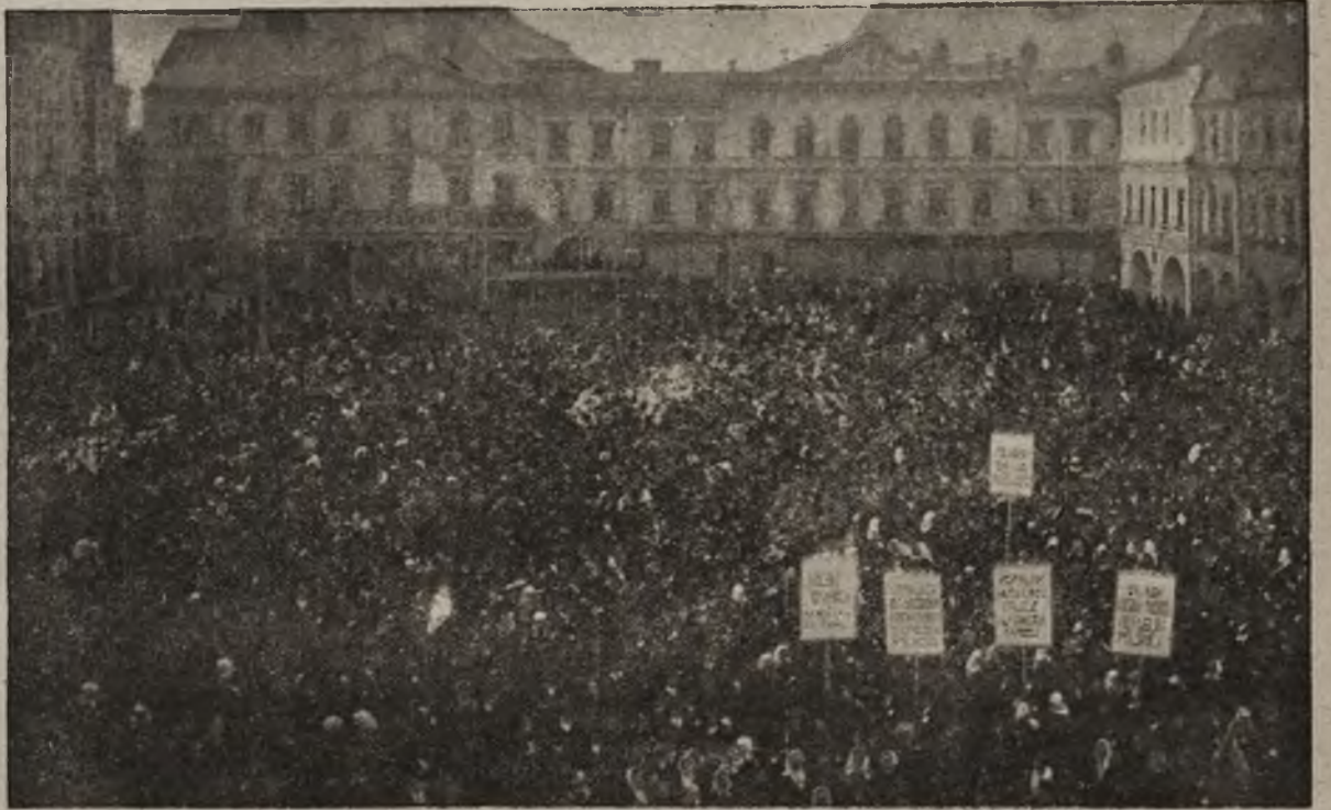
Słask Cieszyński dla Polski: Zgromadzające się 40 tysięczne tłumy ludności polskiej śląskiej na rynku cieszyńskim na wiec w dniu 27 października 1918 r.

Na trzeci dzień odesłano osobnym pociągiem żołnierzy Niemców na zachód; za nimi powoli rozjechali się oficerowie niemieccy. Po dziesięciodni