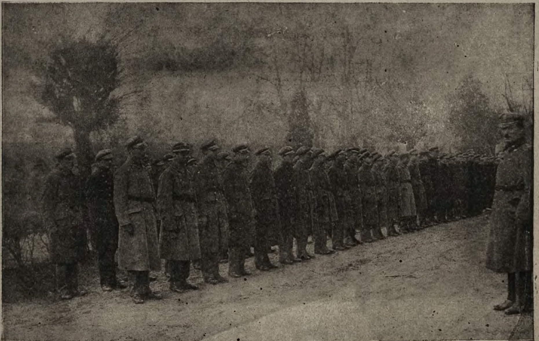
Poświęcenie szkoly podchorążych w Łobzowie: Oddział uczniów szkoly podchorążych.

Na zakończenie uroczystości odbyła się defilada przed gośćmi i oficerskim korpusem, poczem goście zwiedzali szkołę.