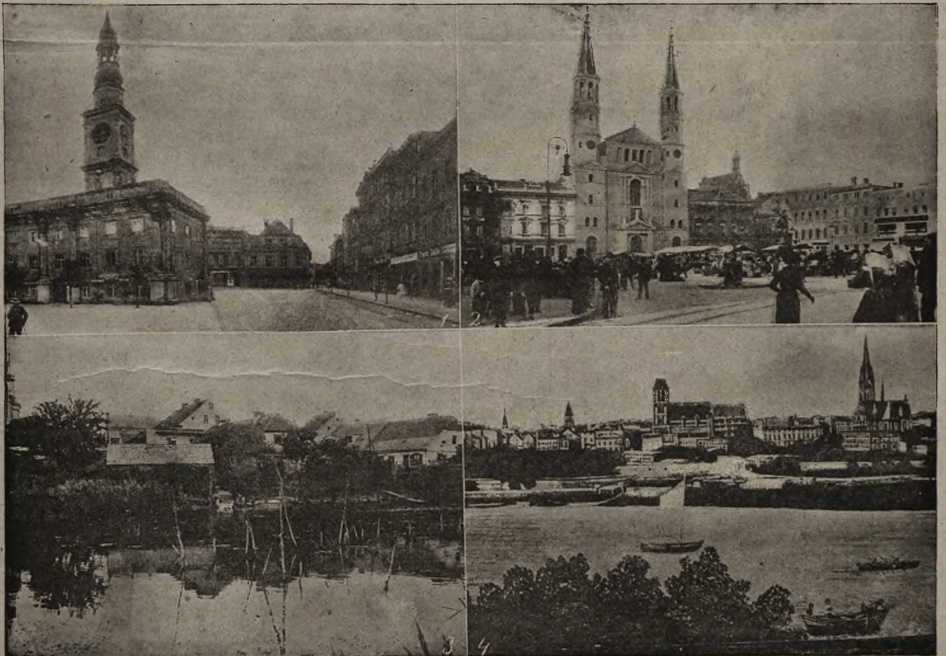
1) Widok miasta Leszna, o które toczyły się walki. 2) Bydgoszcz, o który obecnie toczą się walki 3) Miejscowość Zbąszyn, zdobyta przez Polaków, węzłowy punkt kolei Poznań-Berlin. 4) Widok twierdzy Torunia.

Treść numeru: Słuch Oleszyński dla Polski — Niemcy a Realicya — Rozporządzenie konferencji państwowej. — Walka z bolszewizmem w Niemczech. — Gabinet koalicyjny Radziewskiego itd.