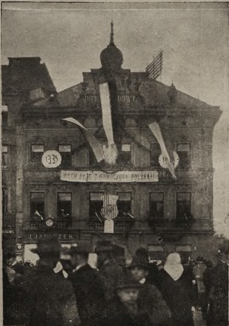
Dom Narodowy w Cieszynie, przystrojony w czasie wiecu