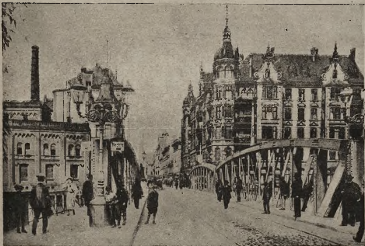
Walki w Poznańskim: Ulica w Poznaniu