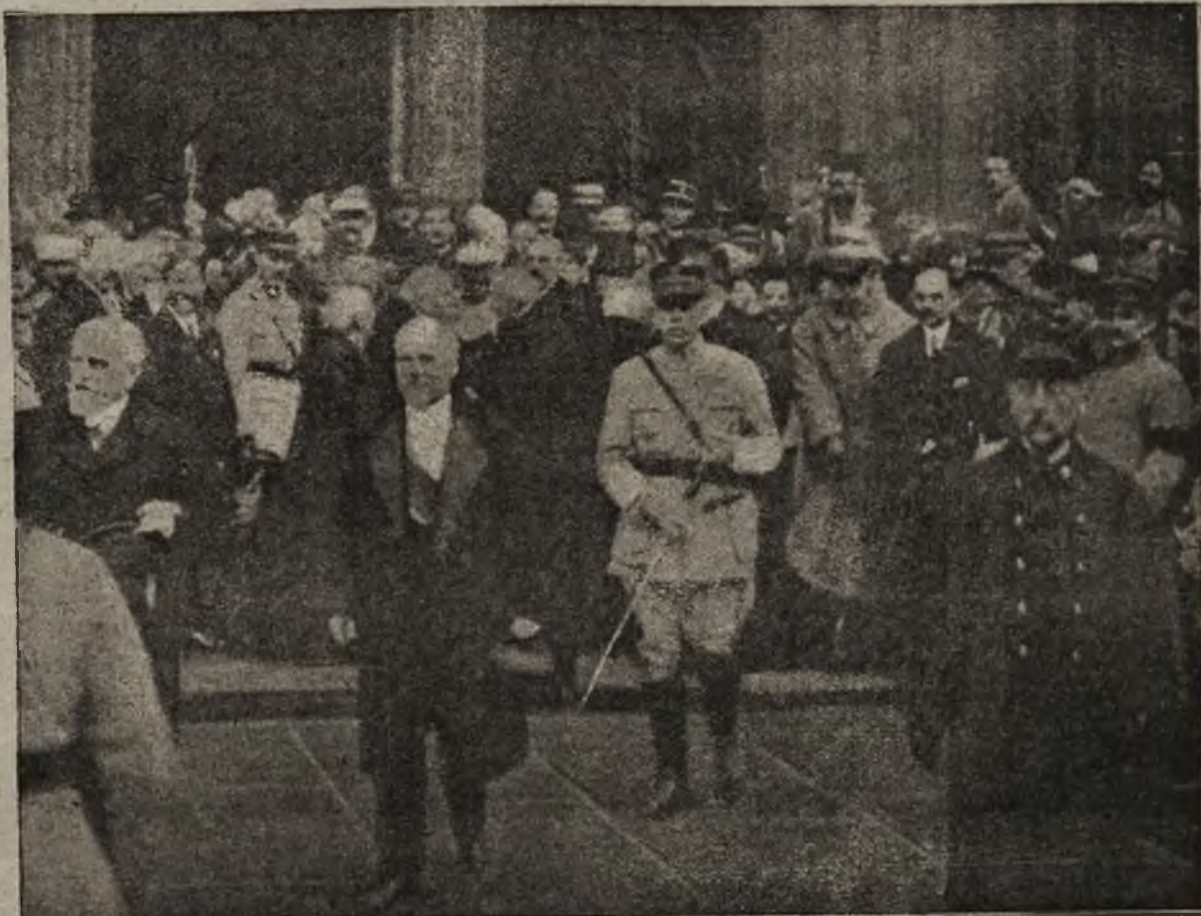
Niemcy a koalicja: Prezydent Poincaré witany owacyjnie w Strassburgu przez Alzackich.

W Paryżu jest o wiele przestroniej, choć i tam robi się ciasno. Poszczególne misje zajęły dla siebie całe hotele, liczące po kilkaset pokoi mieszkalnych, prócz wielkich i wspaniałe urządzonej salonów. Anglicy ulokowali się w czterech pierwszorzędnych hotelach: Majestic, Astoria, Alba i Baltimore; Amerykanie zajęli hotel Grillon, Belgowie hotel Lotti. Japończycy Bristol, Grecy Mercedes, Czechosłowacy i Chińczycy mieszczą się w Lutecyi, Serbowie i Portugalczyki w hotelu Campbell, Włosi w hotelu Edward VII. O wysokości cen dzierżawnych daje pewne wyobrażenie kwota 15.000 franków dziennie, opłacana przez Anglików za hotel Majestic. Dla reprezentantów prasy sprzymierzonej i neutralnej przeznaczyło ministerstwo spraw za