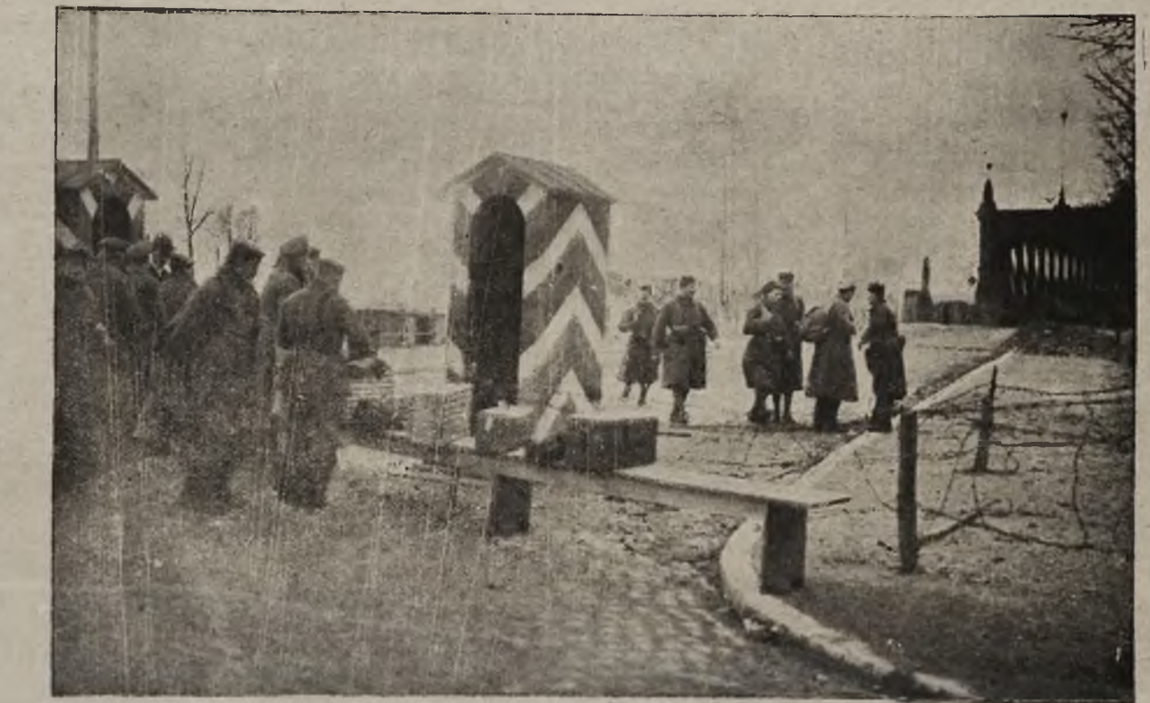
Niemcy a Koalicyja: Posterunek wojsk koalicyji na moście na Renie w Strassburgu. (Lip. 8. pr.)

Obronę zagrożonych granic ojczyzny i troskliwą nad żołnierzem polskim opiekę. Niezłomnie natychmiastowej pomocy cierpiącym masom ludu naszego, a zwłaszcza, tak okrutnie przez wojnę strzywdzonej rzeszy robotników polskich. Sprawaczenie jak najrychlej zapasów żywności. Uruchomienie jak najszyciej warsztatów pracy przez natychmiastę sprawadzenia surowców oraz niezbędnych maszyn fabrycznych. Zaprowadzenie zarowej gospodarki finansowej zapomocą wewnętrznej i zewnętrznej pożyczki oraz wywindowanie sprawiedliwego systemu podatko-