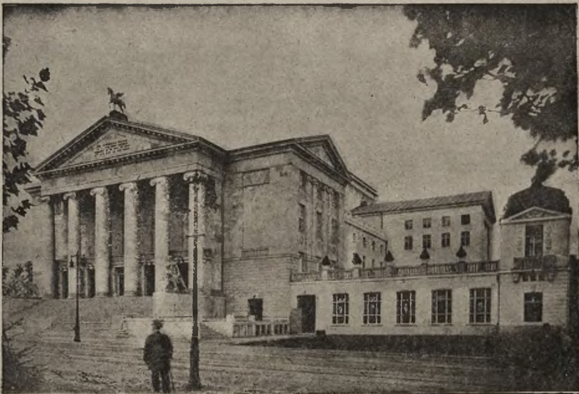
Walki w Poznaniu: Teatr germanizatorski w Poznaniu, który obecnie objęli Polacy.

Liebknecht i Róża Luksemburg pozyskawszy