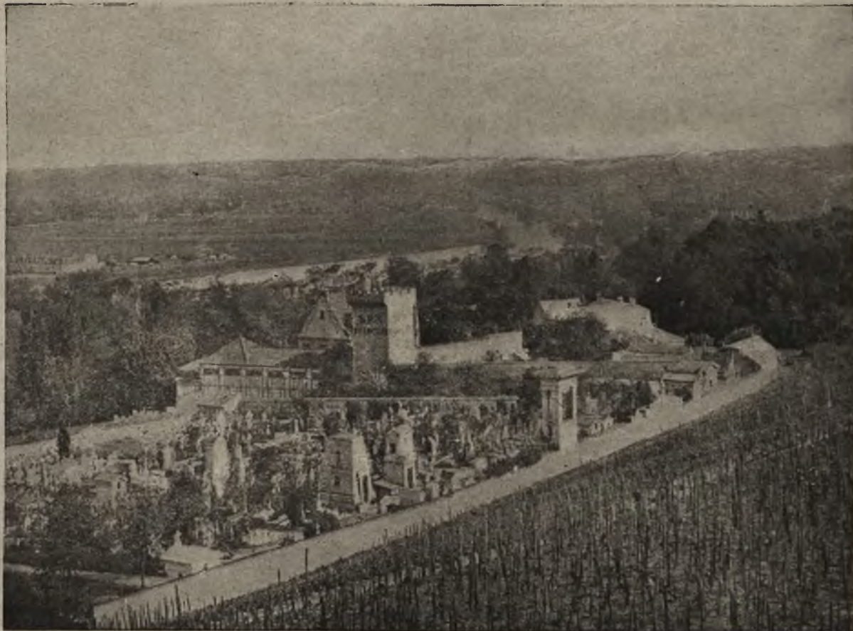
Niemcy a Koalicja: Miejscowość Szań, gdzie urzęduje rozjemca komisy koalicji (Lip b pras).

Do opanowania Cieszyna przygotowywali się oficerowie i Polacy i Czesi i Niemcy, każdy naturalnie na rzecz swej narodowości.