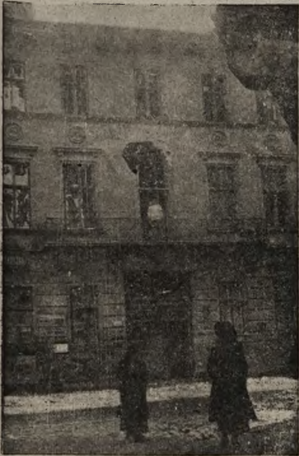
Lwów pod ogniem dział: Ukraiński granat w mieszkaniu dr. Wańkowskiego przy ul. Kościuszki 4

Szkoła ta, po Wawelu jeden z najstarszych budynków Krakowa, była pałacem naszego króla Ka