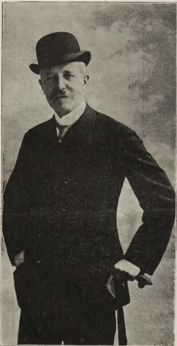
Następca Gołuchowskiego: Dotychczasowy ambasador austro-węgierski w Petersburgu, Alojzy baron Lexa-Aerenthal, który po hr. Gołuchowskim został ministrem domu cesarskiego i spraw zagranicznych w Austro-Węgrzech. ¶

Za niezapłacone podatki: W Bóbrce egzekutor Janowski przeprowadza licytację rzeczy podupadłej rodziny, wystawionych na sprzedaż publiczną za niezapłacony podatek.