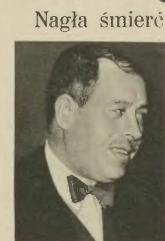
Nagla śmierć premiera egipskiego, Hasana Sabri-Paszy wśród tajemniczych okoliczności nie zmieniła pragnienia Egiptu pozostania neutralnym i wyswo-

rowanie się tylko interesami ogółu. Marszałek Petain współpracuje z Niemcami w dziele odbudowy Europy.