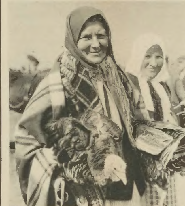
stać nawet na sól czy omasę. Tak było wszędzie.

Jedni mieli za dużo, drudzy nic. Nie tylko w jednym kraju, pomiędzy państwami było tak samo jak pomiędzy pojedynczymi ludźmi.