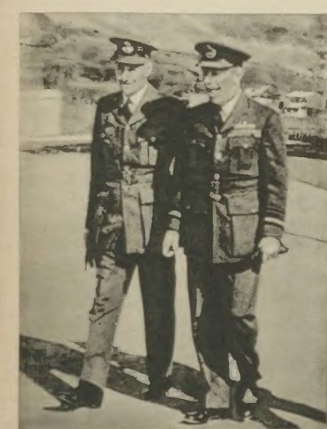
Angielski marszałek lotnictwa Boyd podczas ranego spaceru w obozie dla jeńców-oficerów w towarzystwie swego adiutanta.

w którym leciał objąć swe nowe stanowisko na Wschodzie ujawniło tajne plany angielskiego lotnictwa znalezione przy marszałku.