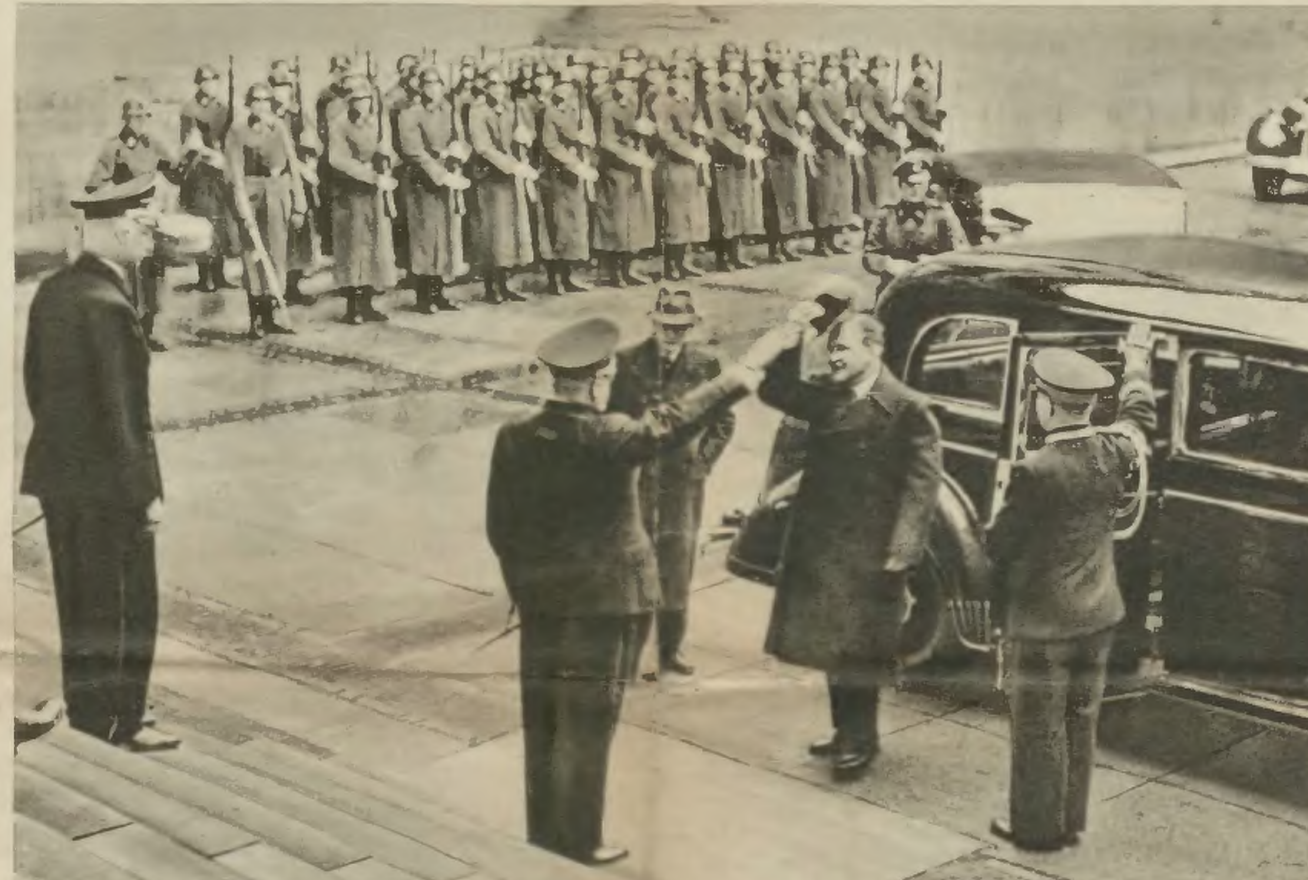
Przewodniczący rady Komisarzy ludowych i komisarz ludowy dla spraw zagranicznych Molotow — uduje się z wizytą do Kancelarii Hitlera. Widzimy go wysiadającego z samochodu przed Kancelarią Rzeszy.

Z jakim zainteresowaniem śledziła Anglia narady berlińskie Molotowa mówi nam natychmiastowa po jego powrocie wizyta ambasadora angielskiego w Moskwie Crippsa. Nie