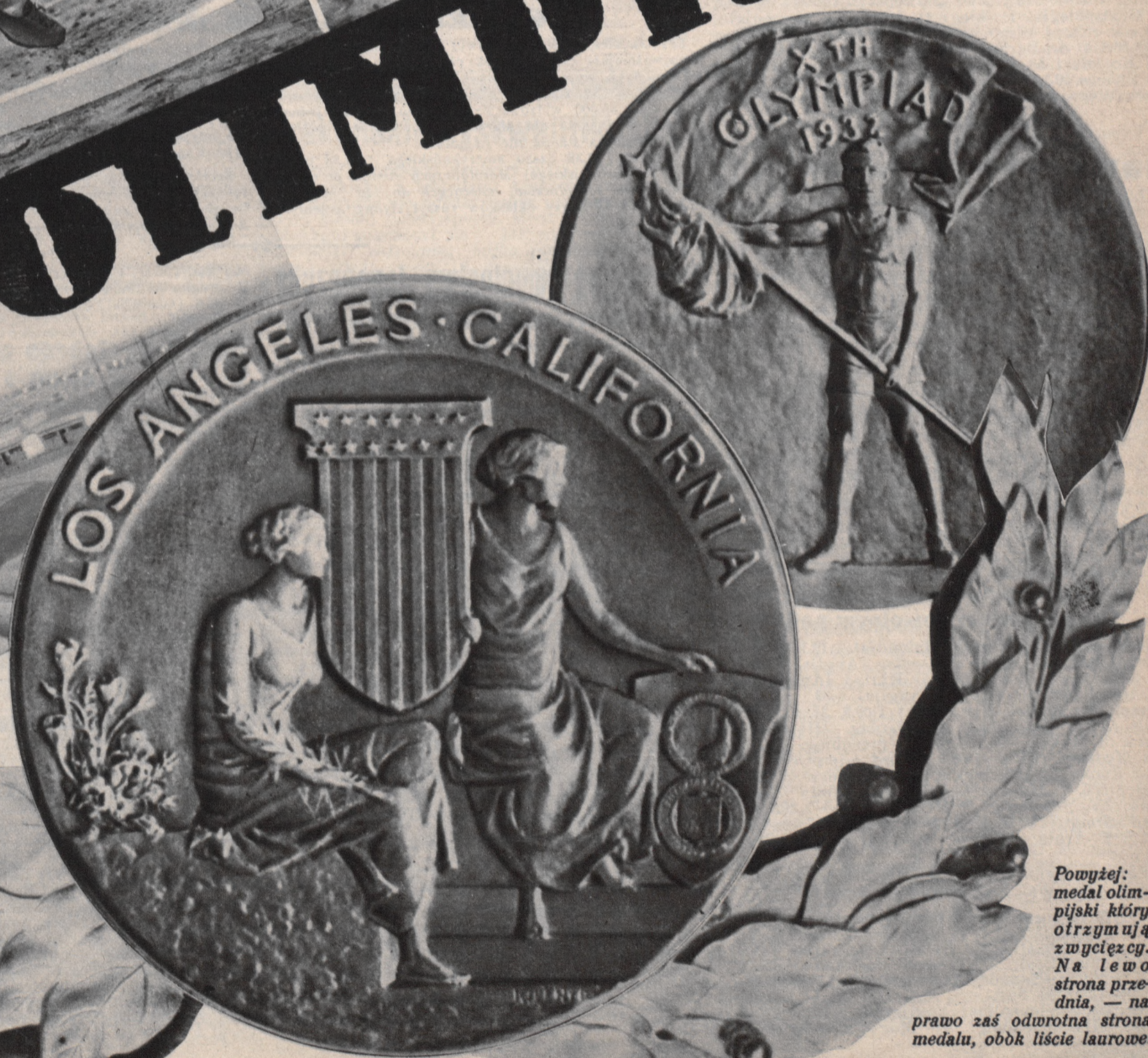
Powyżej: medal olimpijski który otrzymują zwycięzcy. Na lewo strona przednia, — na prawo zaś odwrotna strona medalu, obok liście laurowe.