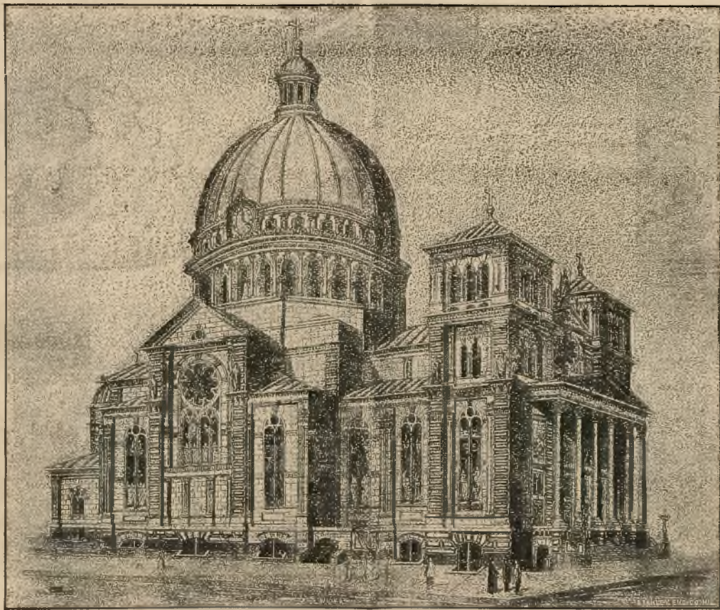
Kościół św. Józefa w Milwaukee Wis.

W dzień Zielonych Świątek, t. j. w niedzielę 21 maja o 2. godzinie po południu, wprowadzony będzie 21 stóp wysoki krzyż na kopułę nowego kościoła św. Józefa. Krzyż ten zabłyśnie najwyżej w powietrzu po nad miastem Milwaukee, bo aż 215 stóp od ziemi.