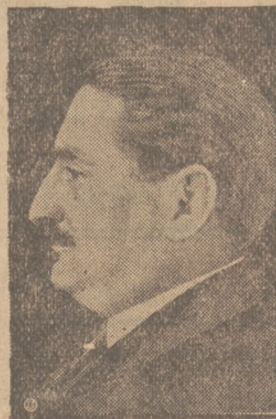
Eynac, min. lotnictwa franc.

Dopiero katastrofalna śmierć samego Bokanowskiego spowodowała rząd francuski do rozdzielenia tych dwóch resortów. Rada ministrów uchwaliła utworzyć osobne ministerstwo dla lotnictwa z odpowiedzialnym szefem w osobie ministra awiatyki. Prezes rady ministrów Poincaré powołał na szefa ministerstwa lotnictwa specjalistę w sprawach awiatyki p. Eynac'a, którego zadaniem będzie zreorganizować lotnictwo francuskie.