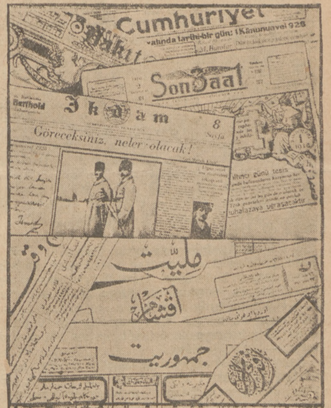
Radykalny przewrót w Turcji.