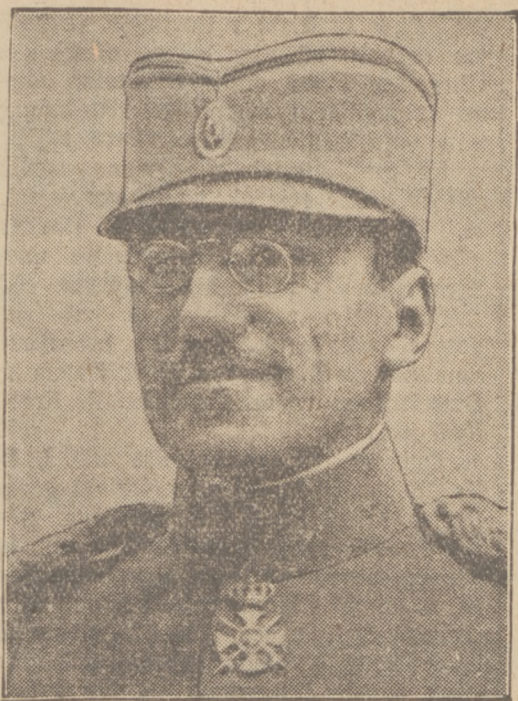
Król Aleksander II.

Władca Jugosławii urodził się 16-go grudnia 1888 r. w Cetinji jako drugi syn króla Piotra. Po zrzeczeniu się tronu przez jego starszego brata Jerzego w roku 1909 został proklamowany następcą tronu. W roku 1914 sprawował rządy za swego chorego ojca, króla Piotra, a od roku 1918 po zakończeniu wojny światowej, w której królestwo serbskie powiększyło się o dawne prowincje austro-węgierskie Bośnię-Hercegowinę, Chorwację, Istrię, Dalmację, Słowenię nad nowym królestwem jugosłowiańskim. W sierpniu 1921 umarł król Piotr i na tron wstąpił Aleksander, liczy zatem 40 lat. Tarcia polityczne pomiędzy Serbami i Chorwatami doprowadziły Jugosławie na skraj przepaści. Atoli król Aleksander jednym zamachem wyrwał kraj z toni, ogłosiwszy w nocy z soboty na niedzielę dyktaturę królewskiej władzy. Konstytucja została zawieszona, parlament (skupczyzna) zamknięty. Król utworzył nowy rząd i na prezesa ministrów powołał dowódcę swej gwardii przybocznej, generała Ziwkowicza.