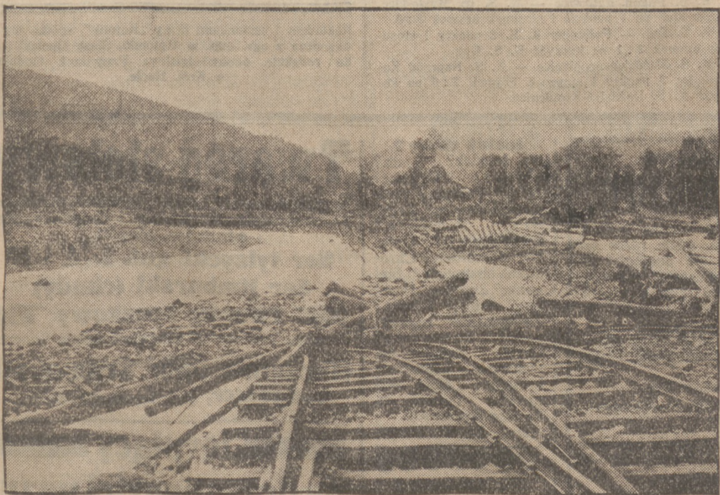
Rozdarte tory kolejowe.

Podczas gdy my w naszej Europie Środkowej mamy najśliczniejsze powietrze słoneczne, oberwały się nad Rumunją w kilku okolicach chmury. Rzeki wezbrały, wody wylały i zatopiły cały kraj na kilkudziesięciu kilometrowym obszarze. Mo-