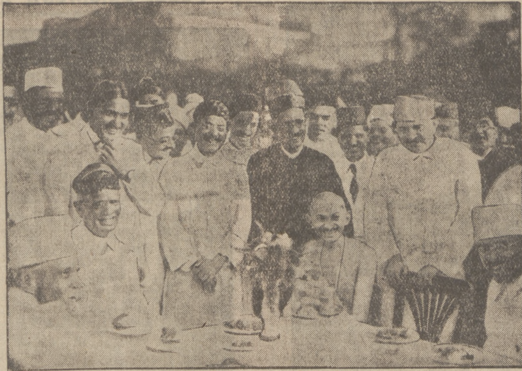
Wódz ruchu niepodległościowego w Indiach angielskich Mahatma Ghandi w gronie swych przyjaciół.