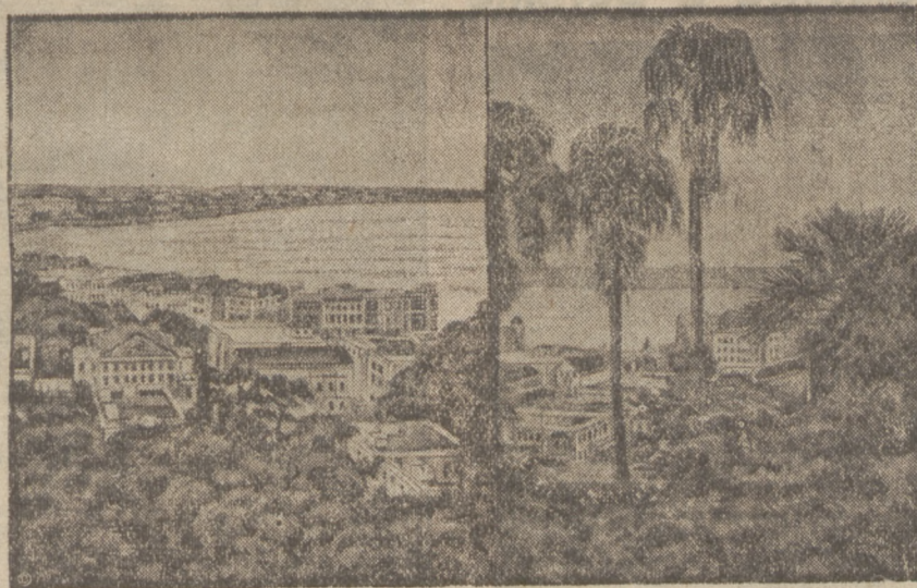
Cel demonstracyjnego marszu Mahatmy Ghandi'ego na wybrzeże oceanu Indyjskiego po sól morską.

Według ostatnich wiadomości otrzymanych w Indiach, pochód Ghandi'ego zbliżył się do terytorjum „wolnego miasta” Baroda, stanowiącego prywatną własność jednego z najbardziej wpływowych maharadzów, który postanowił niedopuszczyć do przemarszów Ghandi'ego przez te posiadłości i zgromadził kilka wiernych mu pułków kawalerji muzułmańskiej. Jeżeli na rozkaz Ghandi'ego nie zostanie obrona inna marszruta pochodu, dojdzie do krwawej masakry, zgromadzonych pod Barodą tłumów.