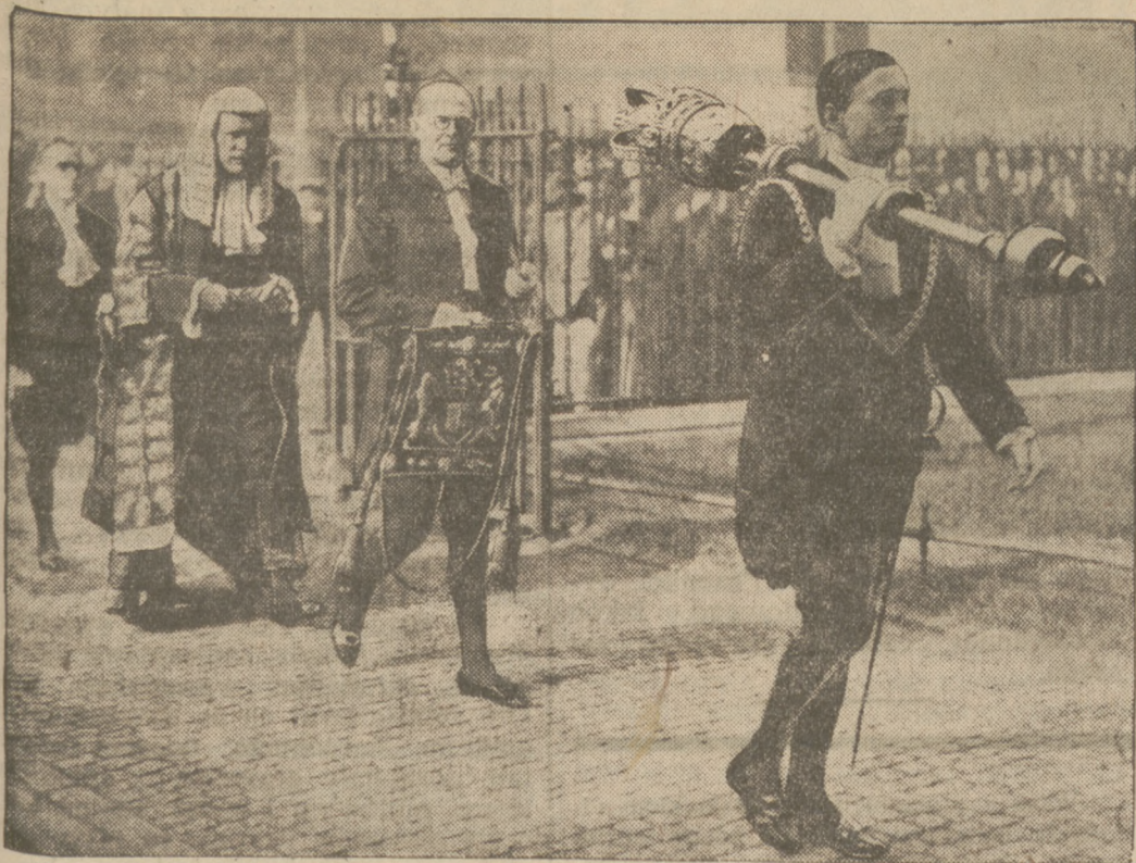
Sesja sądów angielskich rozpoczyna się zawsze z wielką uroczystością. Na obrazku widzimy Lorda Sankeya, prezesa sądu najwyższego, wracającego z kościoła. Przed lordem straż przyboczna niesie godła najwyższego sądu.