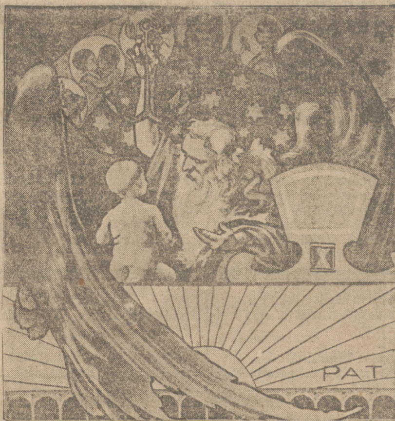
Reprodukcja z obrazu Stachlewicza.

w duchu katolickim i na tej drodze tworzyły ich kulturę. A bodaj, czy cały kryzys światowy, we wszystkich jego przejawach nie jest właśnie kryzysem moralnym, mającym główne swe źródło w zobojętnieniu dla zasad wiary i w nieprzestrzeganiu ich w życiu społecznym.