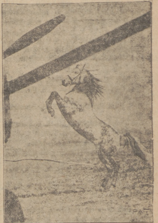
Ten piękny dziki koń buntuje się przeciwko wtargnięciu obcej siły do jego państwa — do stepu. W pierwszej chwili, kiedy samolot wylądował, koń sprężył się do skoku, aby strącić przeciwnika. Tak go właśnie uchwycił fotograf.

Pewnego wieczoru skradziono 80 aut. Stały one przeważnie przed teatrami, kinami i restauracjami. Z sumy tych 80 aut zdołano w ciągu dnia następnego odnaleźć tylko 5.