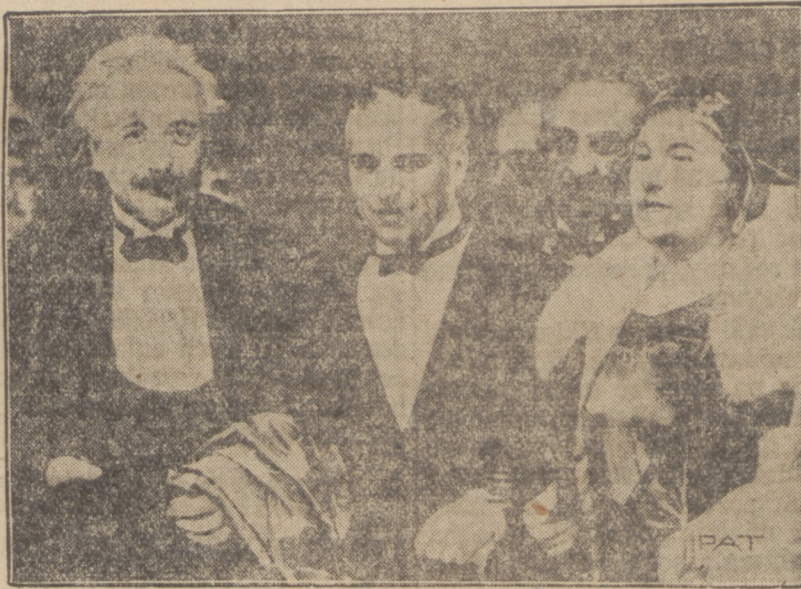
Niedawno na premierze nowego filmu Charlie Chaplina — „Światło miasta” w Hollywood był obecny profesor Albert Einstein. Film ten wzbudził ogromny entuzjazm. Chaplinowi zgotowano wielką owację. Profesor Einstein złożył Charlie Chaplinowi gorące gratulacje. Zdjęcie nasze przedstawia prof. Einsteina z Charlie Chaplinem.