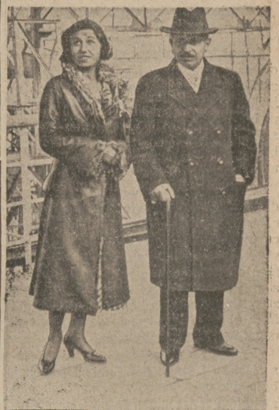
Laval w drodze do Ameryki.

Premjerowi francuskiemu w podróży do Waszyngtonu towarzyszy jego córka, którą obok ojca swego widzimy na pokładzie okrętu.