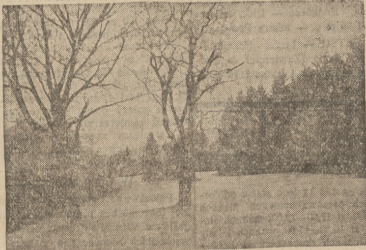
Kilkudziesięciomorgowy park otaczający Dom Rekolekcyjny w Kokoszycah, nastrojający do rozmyślań nad zagadnieniami swej duszy.